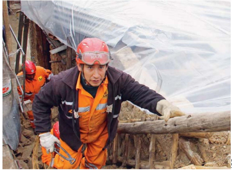
BRIGADA DE RESCATE MUNICIPAL ACUDIÓ AL LUGAR DEL DESPLOME DE MURO EN VINO TINTO. FUE AYER EN LA MAÑANA.

Inf. Pág. 5, 1er. Cuerpo Inf. Pág. 2, 2do. Cuerpo