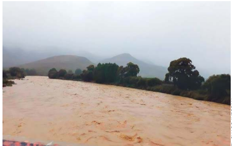
RÍO PILCOMAYO ALCANZA NIVELES HISTÓRICOS.