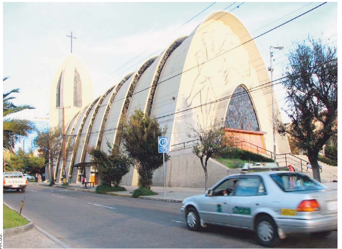
CALLE 21 DE SAN MIGUEL (ZONA SUR DE LA PAZ): COLECTIVOS CIUDADANOS PIDEN QUE CAMBIE DE NOMINACIÓN A "21F-NO".

alcalde Revilla está firmada por los colectivos: Mesa Ciudadana, Basta Ya!!!, Mujeres Fuertes, OIP, Petardos, G21, UPD y Comunicación Inclusiva, Movimiento País y Fuerza Ciudadana.