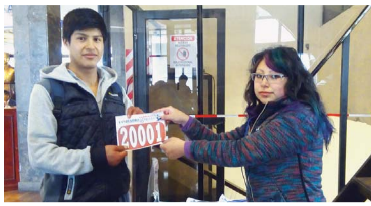
EL PRIMER INSCRITO PARA LA 45 PRUEBA PEDESTRE EL DIARIO.