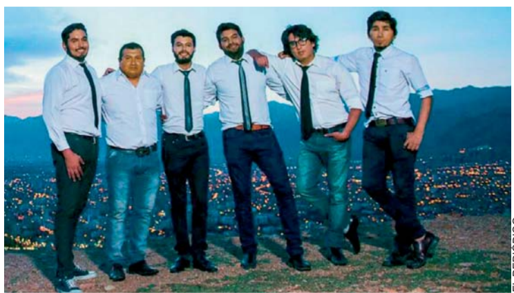
LOS VIDALEROS DE BOLIVIA, ESTA NOCHE PISARÁN ESCENARIO EN VIÑA DEL MAR.