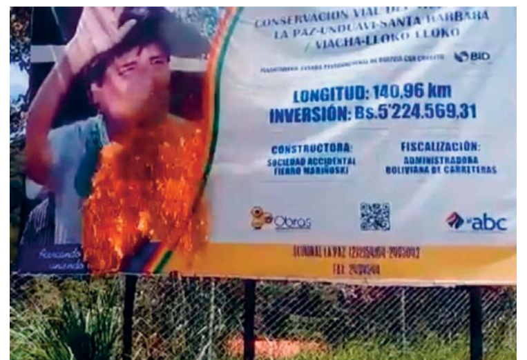
CARTEL QUE FUE QUEMADO EN YOLOLITA-CARANAVI.