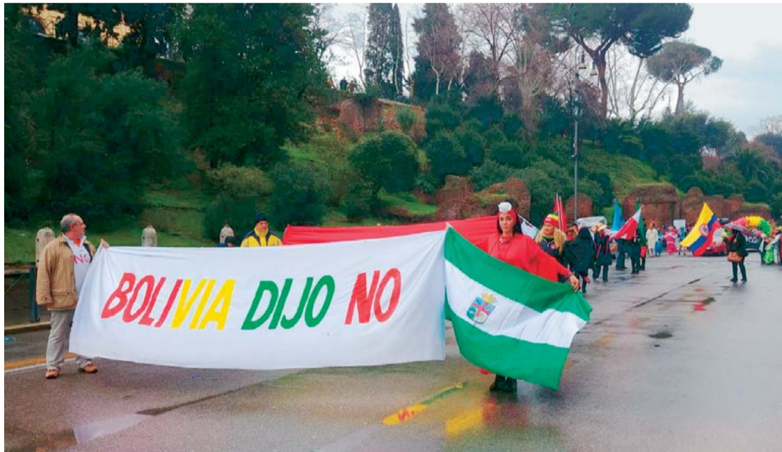
BOLIVIANOS QUE RADICAN EN GINEBRA (SUIZA) SALIERON EL FIN DE SEMANA EN MARCHA EN DEMANDA DE QUE SE RESPETE SU VOTO.

La movilización anunciada para mañana, 21 de febrero, para pedir respeto a la votación que determinó la No repostulación de Evo Morales a la Presidencia para las elecciones de 2019, comenzó hace semanas por las redes sociales.