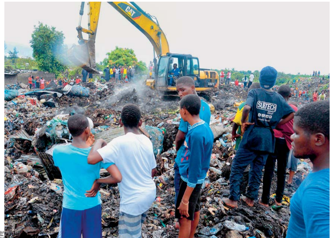
BUSCAN VÍCTIMAS DE ALUD DE BASURA EN ÁFRICA.