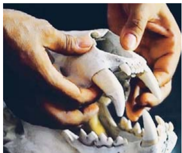
CRÁNEO DE JAGUAR.

Un operativo conjunto, ejecutado entre la Gobernación de Santa Cruz, la Policía y el Ministerio Público, logró encontrar un lugar de tráfico ilegal de dientes de jaguar, de puma, de tigre asiático y piezas de marfil en una venta de pollos en La Ramada, fueron detenidos dos extranjeros asiáticos.