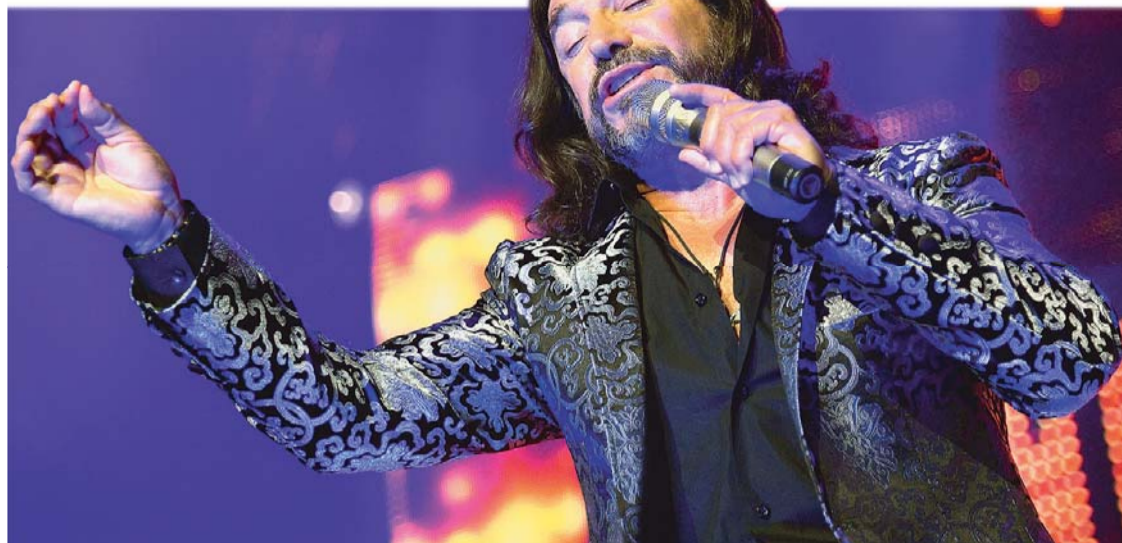
"EL POETA DEL SIGLO" YA PISÓ SUELO CRUCEÑO Y DELEITARÁ ESTA NOCHE AL PÚBLICO BOLIVIANO CON SUS BELLAS CANCIONES.