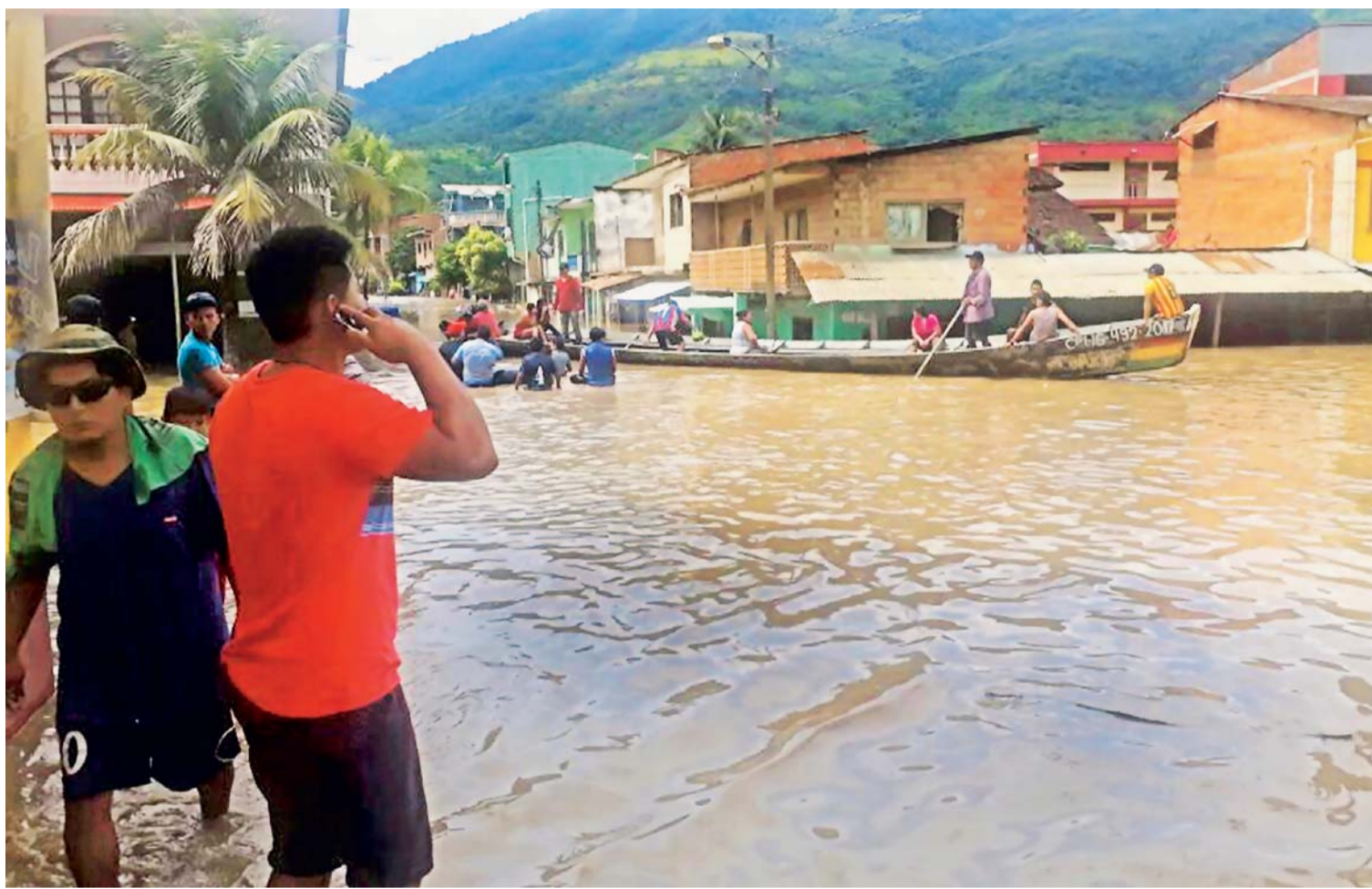
CALLES ANEGADAS EN GUANAY Y LOS HABITANTES QUE SE TRANSPORTAN EN PEQUEÑAS EMBARCACIONES.