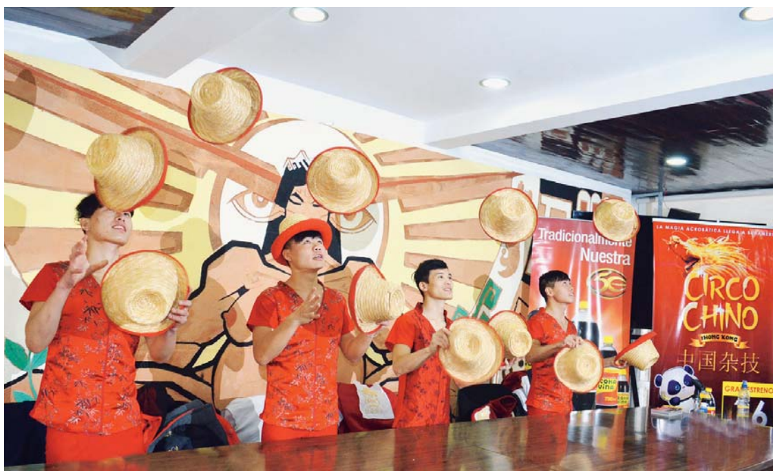
DESTREZA, MAGIA Y ACROBACIA TRAE ESTE CIRCO PARA EL DELEITE DEL PÚBLICO PACEÑO.