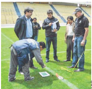
EMISARIOS DE CONMEBOL INSPECCIONARON AYER EL ESTADIO PACEÑO.