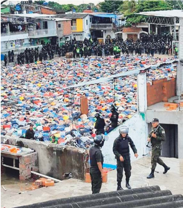
REQUISA EN EL PENAL DE PALMASOLA DE SANTA CRUZ EL 14 DE MARZO.

Los días del operativo policial al penal de Palmasola, en el que perdieron la vida ocho personas y hubo decenas de heridos, el Ministro de Gobierno, Carlos Romero, reveló que un factor que influyó para tomar la decisión de intervenir la cárcel fue "la latente amenaza de una confrontación entre grupos de poder al interior del penal", aspecto que era conocido desde 2013 por autoridades de seguridad interna del Estado.