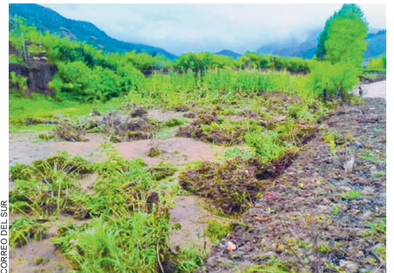
LOCALIDAD DE AZURDUY (CHUQUISACA), AFECTADA POR LA LLUVIA.