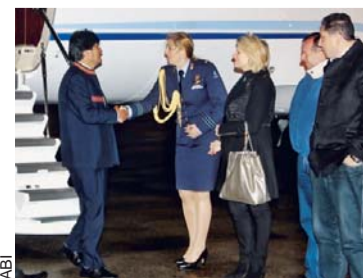
ARRIBO DE MORALES A LA HAYA.