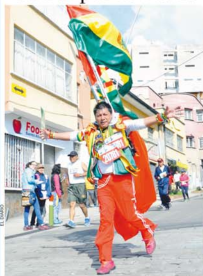
CON LA ROJO, AMARILLO Y VERDE EN EL ALMA, CORRER ES UNA PASIÓN.

Una de las experiencias más hermosas de la vida es participar en una competencia como la Prueba Peditre Internacional de EL DIARIO, el orgullo de representar a la Patria y llevar en alto la rojo, amarillo y verde no tiene igual.