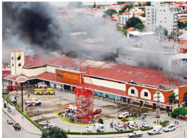
SUPERMERCADO DE SANTA CRUZ SE INCENDIÓ AYER Y POR FORTUNA NO HUBO DESGRACIAS HUMANAS, SÓLO PÉRDIDAS MATERIALES.