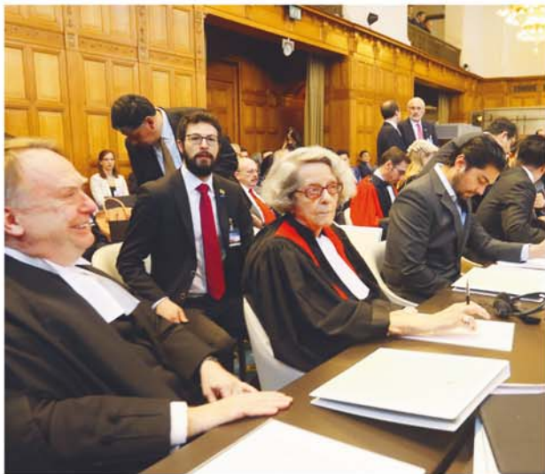
EQUIPO JURÍDICO BOLIVIANO DURANTE LA PRESENTACIÓN DE RÉPLICA. FUE AYER EN LA HAYA.

Ala conclusión de la réplica en los alegatos orales presentados, ayer, por el equipo jurídico boliviano, en el marco del juicio instaurado a Chile ante la Corte