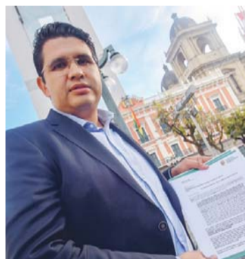
SECRETARIO DE LA GOBERNACIÓN DE SANTA CRUZ.