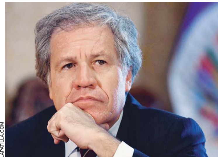
SECRETARIO GENERAL DE LA OEA, LUIS ALMAGRO.

También hizo una mención al caso boliviano, en la que el presidente Evo Morales obtuvo la posibilidad de reelegirse indefinidamente, a través de una resolución emitida en 2017 por el Tribunal Constitucional Plurinacional (TCP).