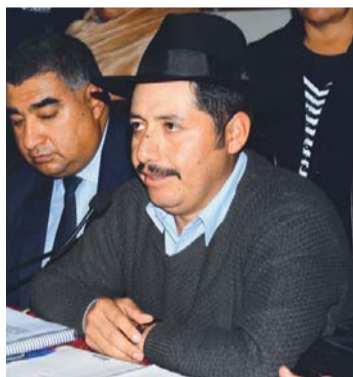
GOBERNADOR DE CHUQUISACA.