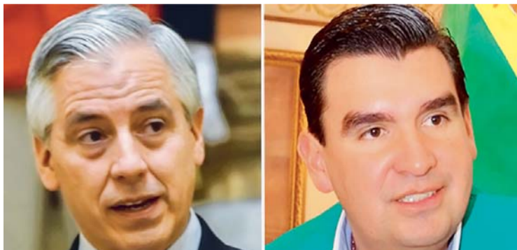
VICEPRESIDENTE DEL ESTADO Y ALCALDE DE COCHABAMBA.