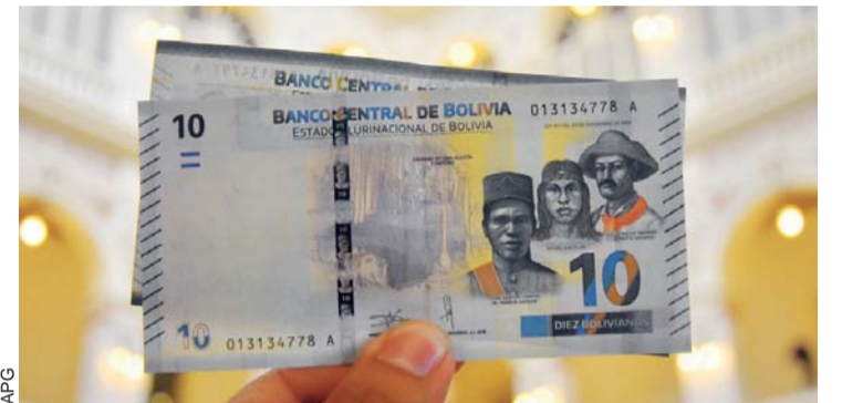
NUEVO BILLETE DE BS 10, QUE DESDE AYER ENTRÓ EN CIRCULACIÓN.

Inf. Págs. 4, 1er. Cuerpo 6, 4to. Cuerpo