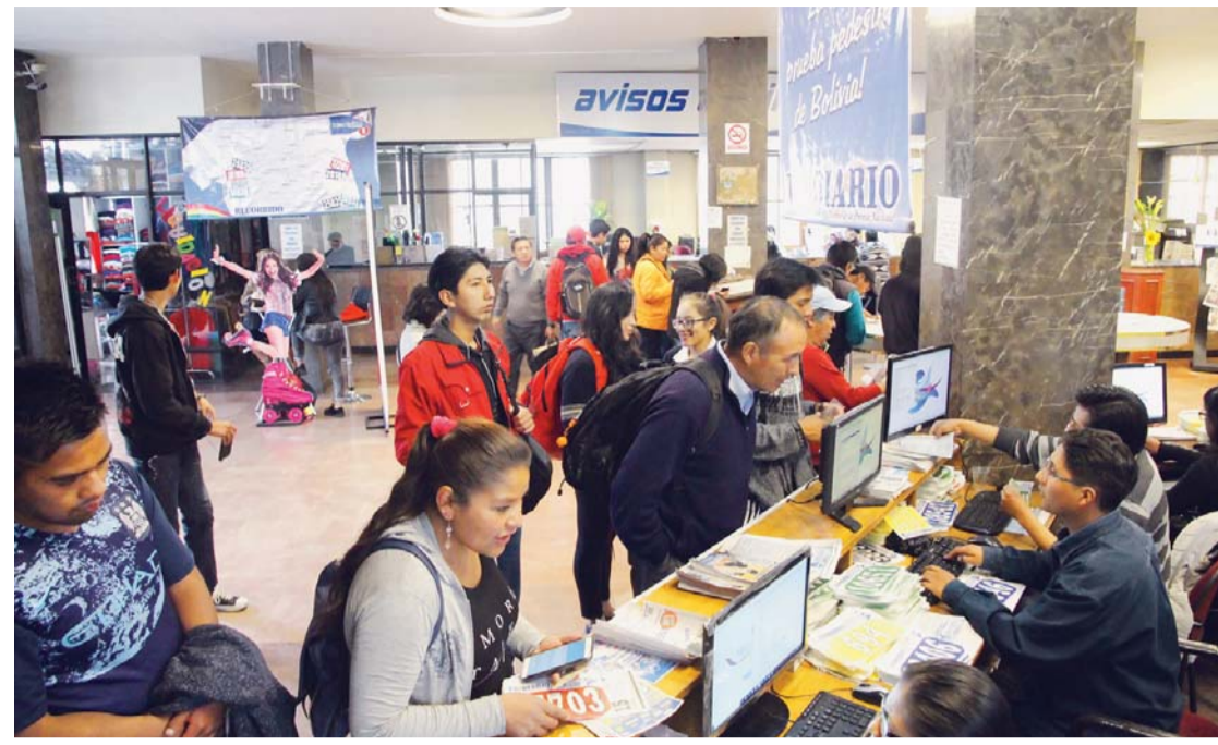
PERSONAS QUE CON SU ENTUSIASMO Y COMPROMISO APOYAN LA INICIATIVA DE NUESTRO MATUTINO.

De igual forma, nuestros sitios de internet reciben cientos de visitantes por jornada y la mayoría de ellos, también se apunta para ser parte del evento atlético del año.