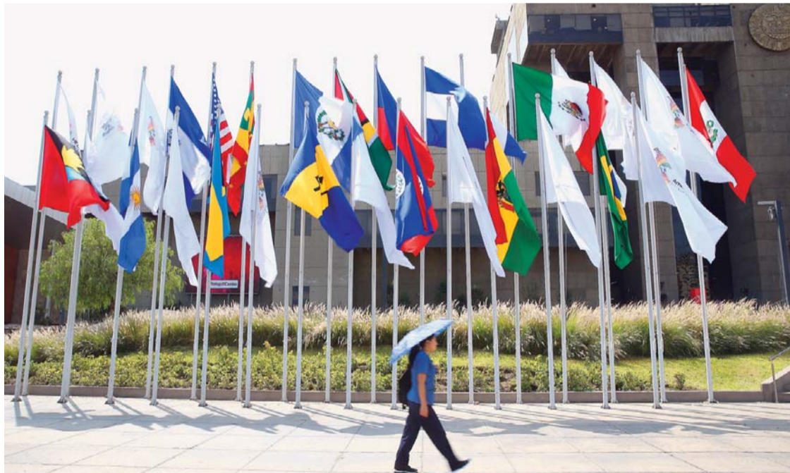
PERÚ EN LAS PREVIAS AL RECIBIMIENTO DE LOS PRESIDENTES DE LAS AMÉRICAS.

Lima, Perú, será sede de la VIII Cumbre de las Américas este fin de semana. Los presidentes de Estados Unidos, Donald Trump, y Nicolás Maduro de Venezuela —ambos de políticas totalmente adver-