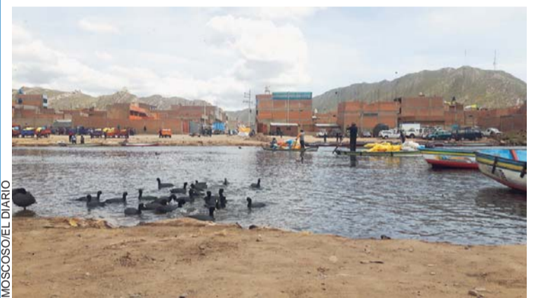
BELLA ESPECIE DE AVE ANDINA QUE ES CUIDADA POR LOS BALSEROS DEL LAGO TITICACA.