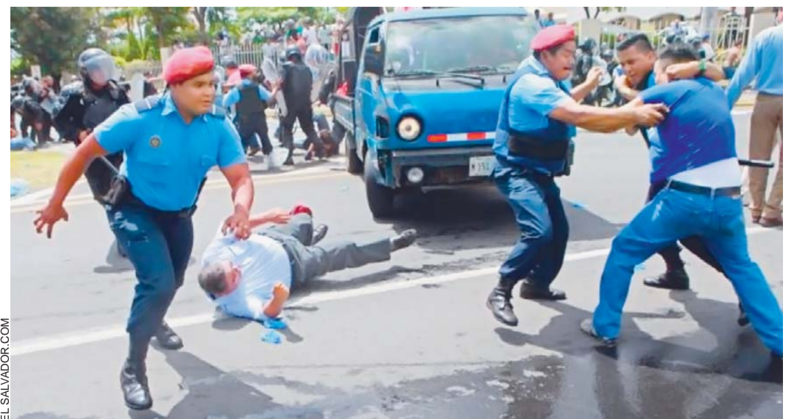
LA REPRESIÓN EN NICARAGUA, DURANTE LOS ÚLTIMOS DÍAS, LLEGÓ A LÍMITES INCONTROLABLES.