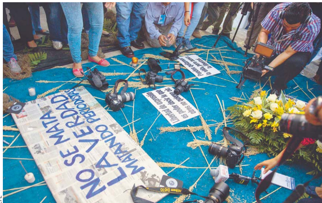
VARIOS PERIODISTAS Y FOTÓGRAFOS COLORON CÁMARAS Y GRABADORAS PARA DEMANDAR LIBERTAD DE PRENSA Y JUSTICIA POR LA MUERTE DEL PERIODISTA ÁNGEL GAHONA.

En la actividad se hizo un minuto de silencio mientras redactores, camarógrafos y fotógrafos colocaban sus cámaras, grabadoras o micrófonos al pie del altar en donde se le rindió homenaje a Gahona.