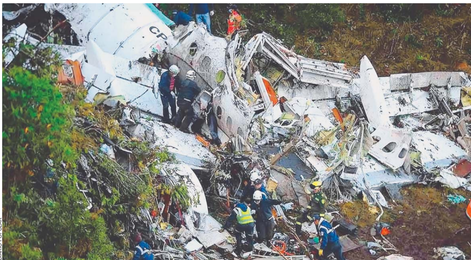
ACCIDENTE DE LAMIA QUE ENLUTÓ A TRES PAÍSES EN NOVIEMBRE DE 2016.