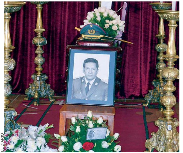
LOS RESTOS DE LUIS GARCÍA MEZA FUERON CREMADOS LUEGO DE UNA MISA.