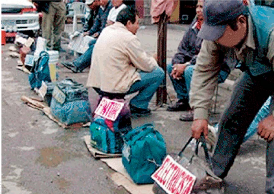
¿QUÉ VAMOS HACER LOS QUE NO TENEMOS TRABAJO FIJO?, ES LA PREGUNTA DE MUCHOS BOLIVIANOS EN ESTE 1 DE MAYO.

Asimismo, la Cámara Departamental de Construcción de Santa Cruz, al igual que otros sectores, se declaró en emergencia ante el aumento salarial dispuesto por el Gobierno y la COB.