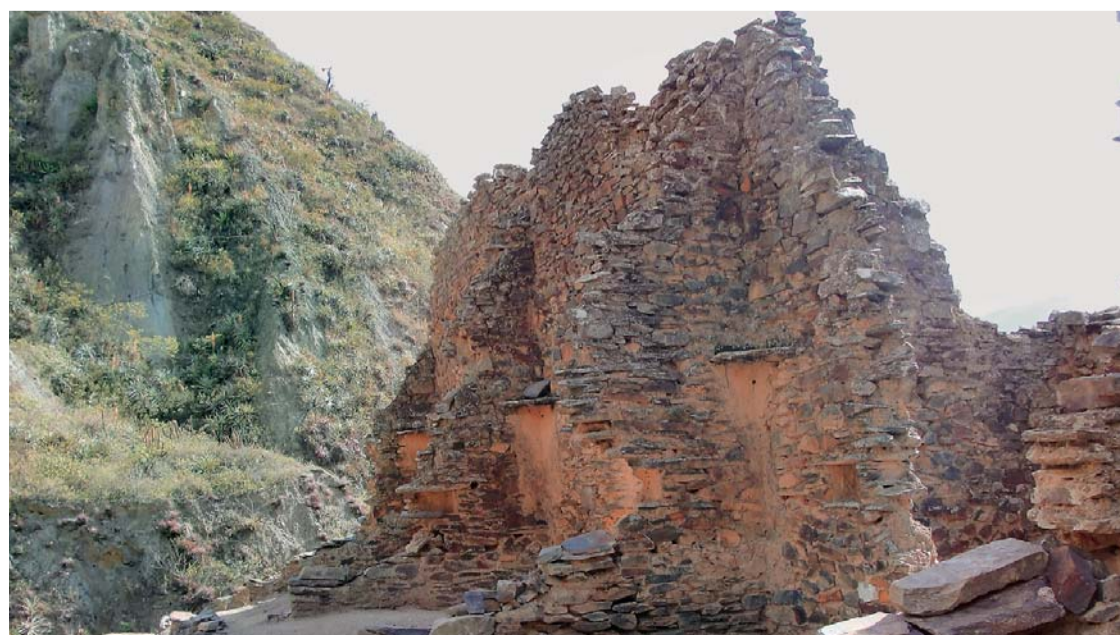
RUINAS DE ISKANWAYA, EN LA PROVINCIA MUÑECAS DE LA PAZ.

La moda llega a todos lados y los desayunos no iban a ser menos. Si quieres prepararte para lucir una buena figura y adquirir nuevos hábitos saludables al mejor estilo de las influencers... tenemos un artículo para ti.