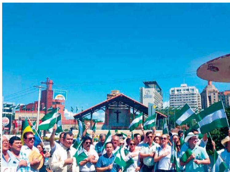
LAS MOVILIZACIONES EN SANTA CRUZ Y CHUQUISACA NO CESAN POR EL CONFLICTO DE LÍMITES Y LA UBICACIÓN DEL CAMPO GASÍFERO DE INCAHUASI.