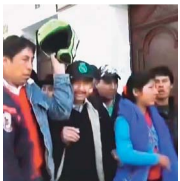
CORREO DEL SUR