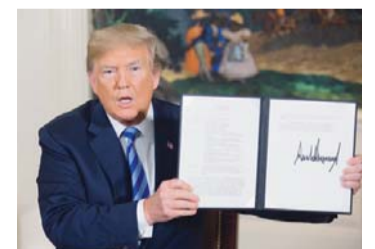
PRESIDENTE DE EEUU.

El presidente estadounidense, Donald Trump, anunció ayer que retirará a Estados Unidos del acuerdo nuclear con Irán de 2015 y volverá a imponer las sanciones levantadas bajo el pacto, al considerar que hay "pruebas" de que Teherán mintió cuando dijo que su programa atómico tenía fines pacíficos.