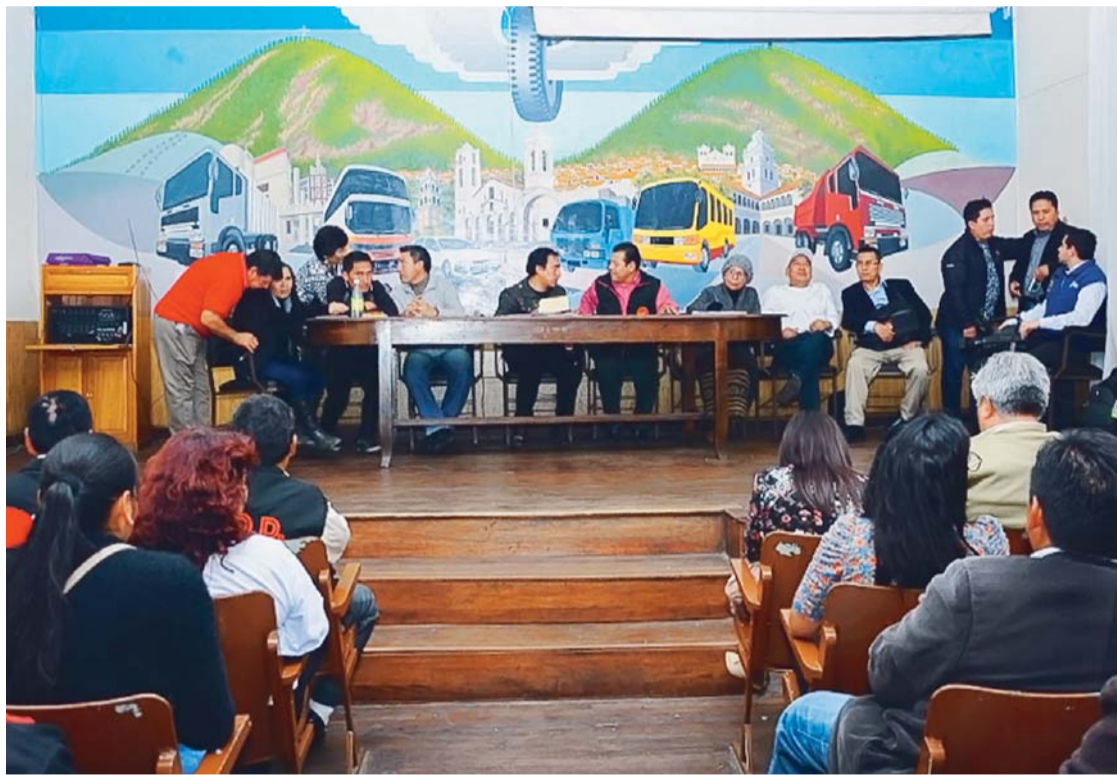
ASAMBLEA CONVOCADA POR EL COMITÉ CÍVICO DE DEFENSA DE LOS INTERESES DE CHUQUISACA (CODEINCA) FUE AYER EN SUCRE.

Durante un convulsionado día, en la víspera, la asamblea convocada por el Comité Cívico de Defensa de los Intereses de Chuquisaca (Codeinca) determinó rechazar la propuesta del Gobierno, además de masificar la presión por Incahuasi.