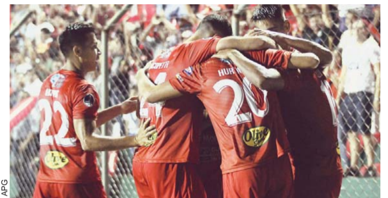
GUABIRÁ FESTEJA UNA VICTORIA QUE NO LE SIRVIÓ DE NADA.

Guabirá se despidió anoche de la Copa Sudamericana pese a triunfar de local (3-2) frente a Liga Deportiva Universitaria de Quito, en Montero, Santa Cruz.