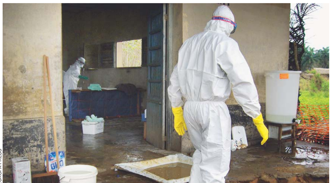
FUMIGACIÓN Y LIMPIEZA ANTE EL BROTE DE LA TEMIDA ENFERMEDAD.