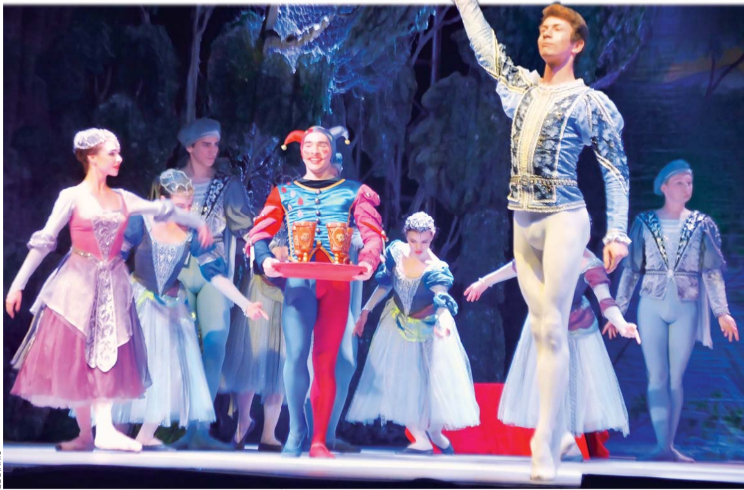
UNA VEZ MÁS EL PÚBLICO PACEÑO TUVO LA OPORTUNIDAD DE PRESENCIAR LA DESLUMBRANTE PRESENTACIÓN DEL BALLET NACIONAL DE RUSIA EN EL COLISEO DON BOSCO.

El ballet, considerado como uno de los mejores representantes de Rusia, también cuenta con Cascanueces y La Bella. Además, el elenco ruso está integrado con grupos de artistas de reconocida trayectoria en todo el mundo, según el director Davidov.