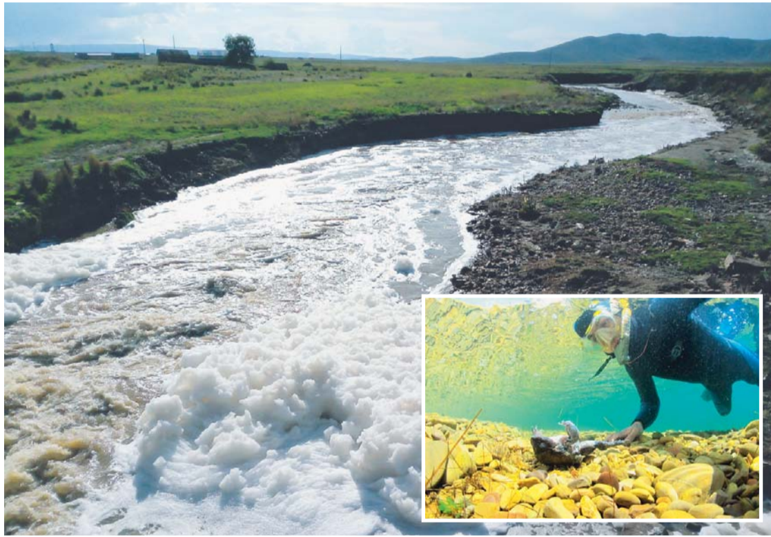
LAS CORRIENTES DE AGUA DE RÍOS QUE CONFLUYEN EN EL TITICACA ARRASTRAN MATERIAL TÓXICO AL LAGO QUE AFECTA DE MANERA ALARMANTE, YA POCO A POCO DESTRUYE SU ECOSISTEMA Y PONE EN SERIO RIEGO A LAS ESPECIES QUE ALBERGA.

Agencia Francesa de Desarrollo (AFD), Rémy Rioux, expresó la intención de invertir $us 115 millones en Bolivia para impulsar el programa de descontaminación del lago Titicaca.