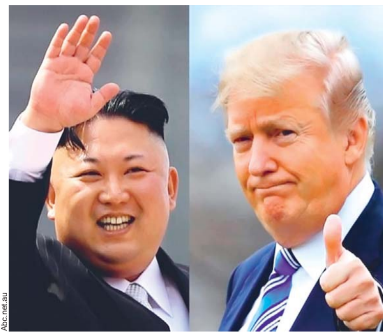
KIM JONG-UN Y DONALD TRUMP EN SINGAPUR.