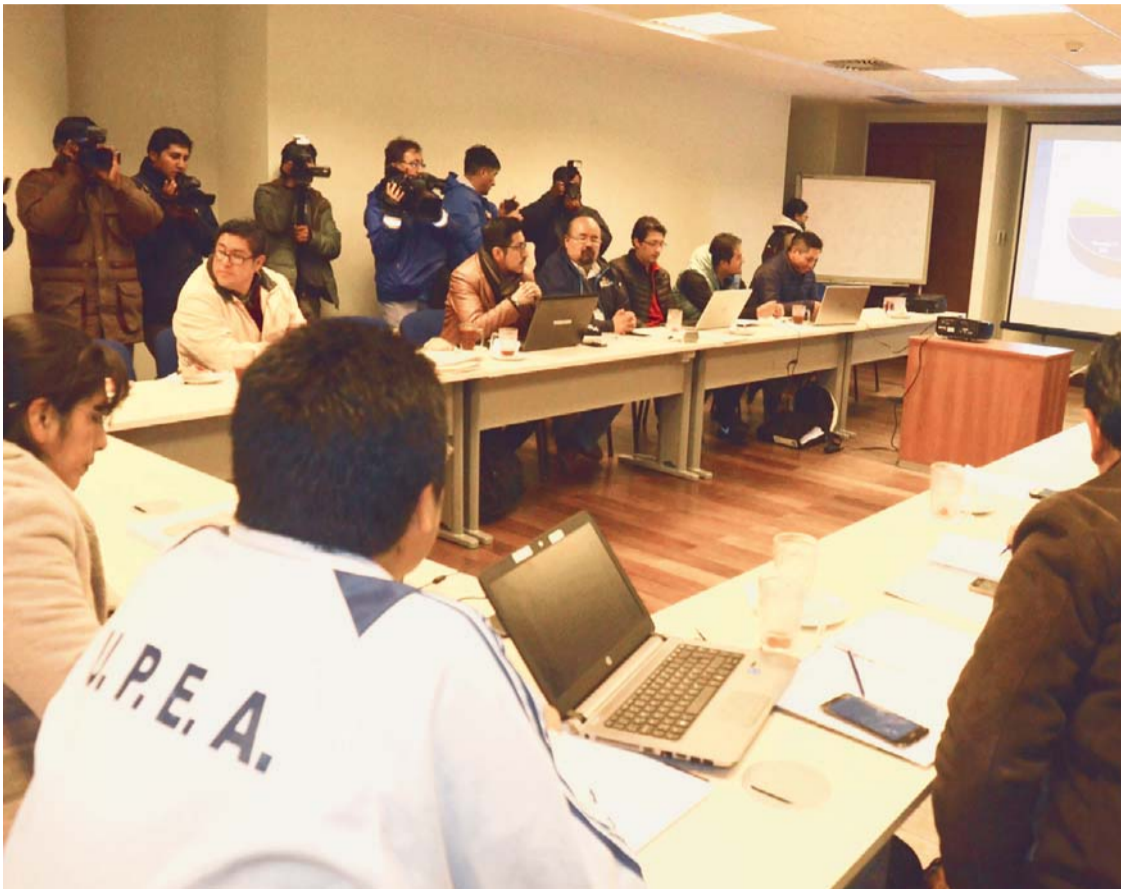
REPRESENTANTES DE UPEA DECIDIERON ROMPER NEGOCIACIONES AL NO ARRIBAR A ACUERDOS CON AUTORIDADES DEL GOBIERNO.

Luego de nueve horas de discusión, autoridades de la Universidad Pública de El Alto (UPEA) decidieron ayer romper las negociaciones con el Gobierno al no llegar a un acuerdo sobre el tema del déficit presupuestario de la casa de estudios superiores; sin embargo, el viceministro Jaime Durán lamenta la decisión de la universidad, pero reiteró que la modificación de la Ley 195 es inviable.