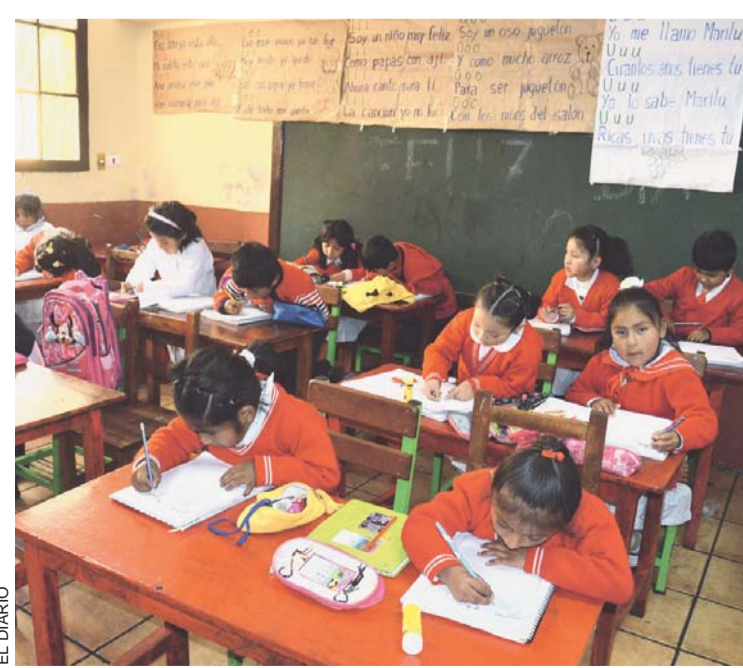
ANTE LAS BAJAS TEMPERATURAS SE APLICA EL HORARIO AMPLIADO PARA LOS ESCOLARES.