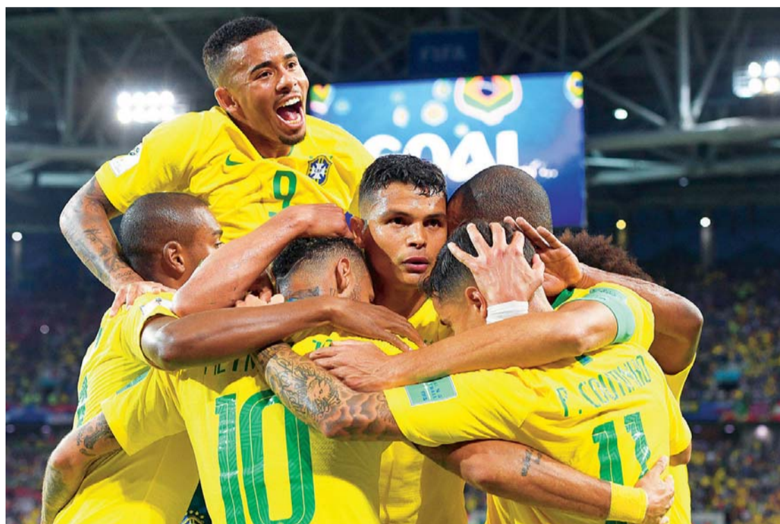
FESTEJO BRASILEÑO QUE PERMITE SOÑAR A TODA SUDAMÉRICA.