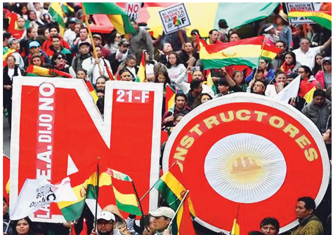
CONCENTRACIÓN DE CIUDADANOS PIDIENDO RESPETO A LOS RESULTADOS DE LA VOTACIÓN DEL 21 DE FEBRERO DE 2016.

En tanto, en las últimas semanas, desde el presidente Morales hasta algunos diri-