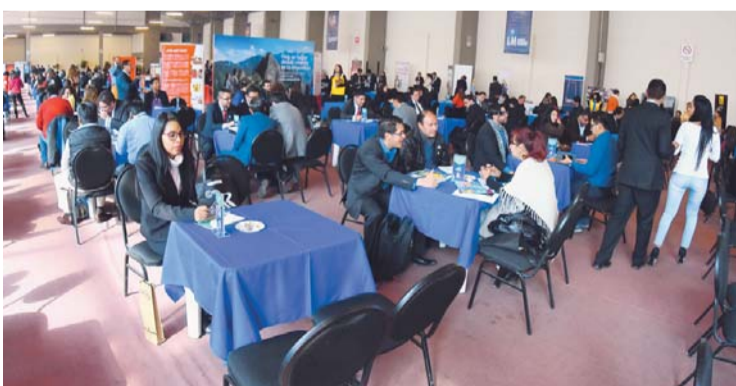
INSTANCIA DE LA 11ª RUEDA INTERNACIONAL DE NEGOCIOS ORGANIZADA POR LA CÁMARA NACIONAL DE COMERCIO EN LA PAZ.