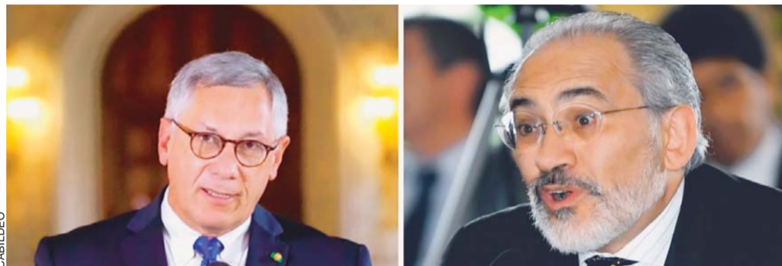
EXPRESIDENTES DE ESTADO ENTORNO AL CASO QUIBORAX.