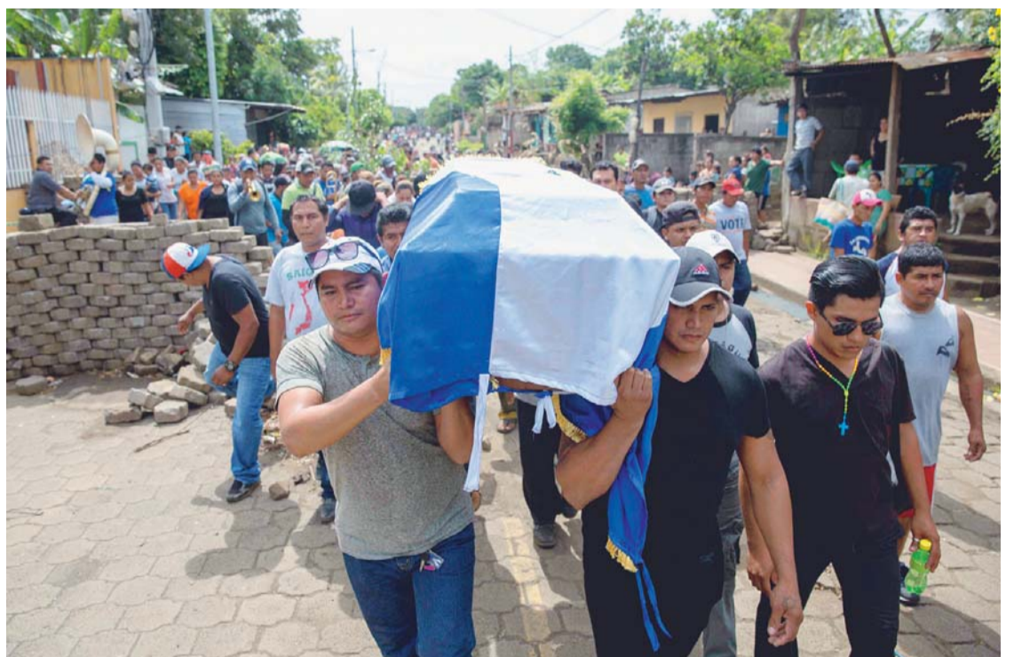
HASTA EL MOMENTO, 351 PERSONAS PERDIERON LA VIDA EN LOS ENFRENTAMIENTOS DE NICARAGUA.