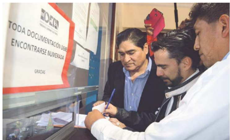
REPRESENTANTES DE PLATAFORMAS DEJAN CARTA EN EL TSE.