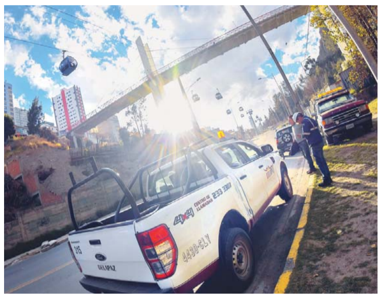
ATENCIÓN DE LA EMPRESA PROVEEDORA DE ENERGÍA ELÉCTRICA EN LA LÍNEA CELESTE DEL TELEFÉRICO.