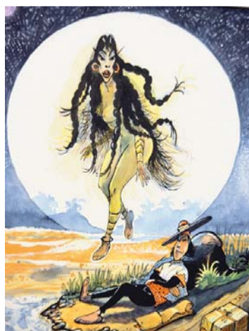
LO MEJOR DEL ARTE EN VIÑETAS ESTÁ EN LA PAZ.