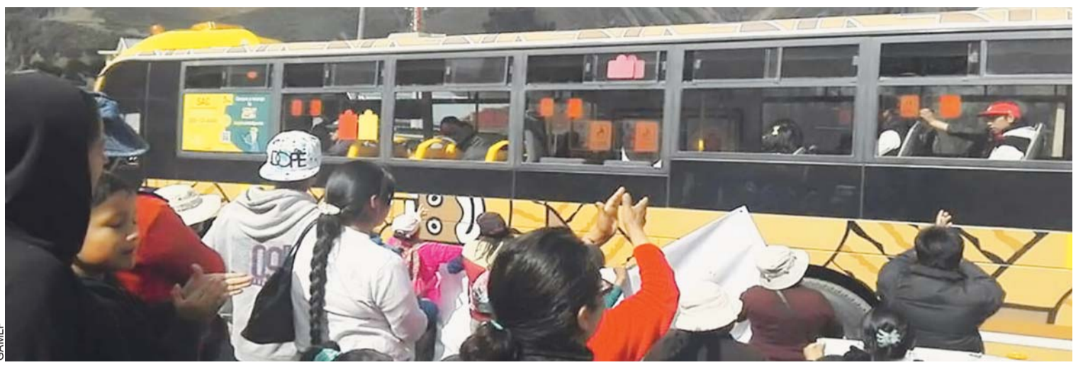
UNA VEZ REESTABLECIDO EL SERVICIO, LOS VECINOS DE PERIFÉRICA EXPRESARON ALGARABÍA CON APLAUSOS Y "VIVAS" A ESTE SISTEMA ALTERNATIVO DE TRANSPORTE EN LA PAZ.