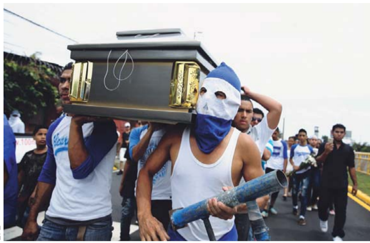
ENTIERRO DE UN UNIVERSITARIO, VICTIMADO EN NICARAGUA.