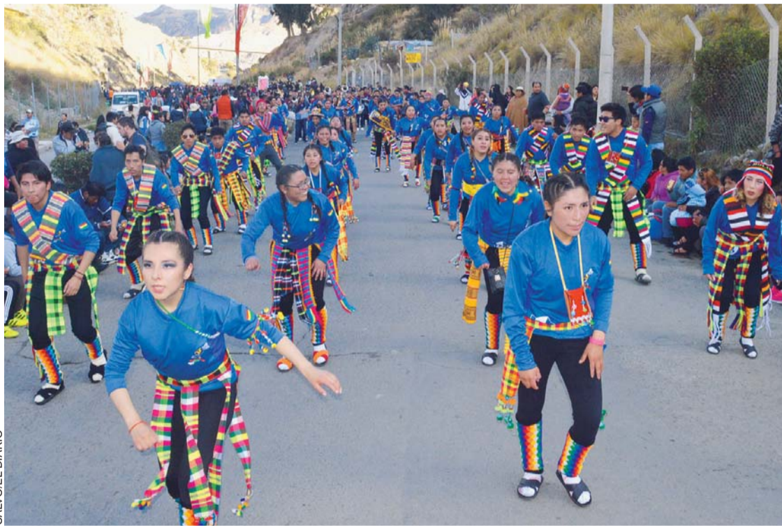
UNIVERSITARIOS DE LA PAZ, NUEVAMENTE REALIZARÁN UNA DEMOSTRACIÓN DE FOLKLORE POR LAS CALLES CÉNTRICAS.