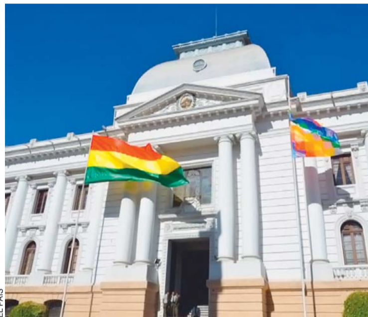
TRIBUNAL SUPREMO DE JUSTICIA DE BOLIVIA.