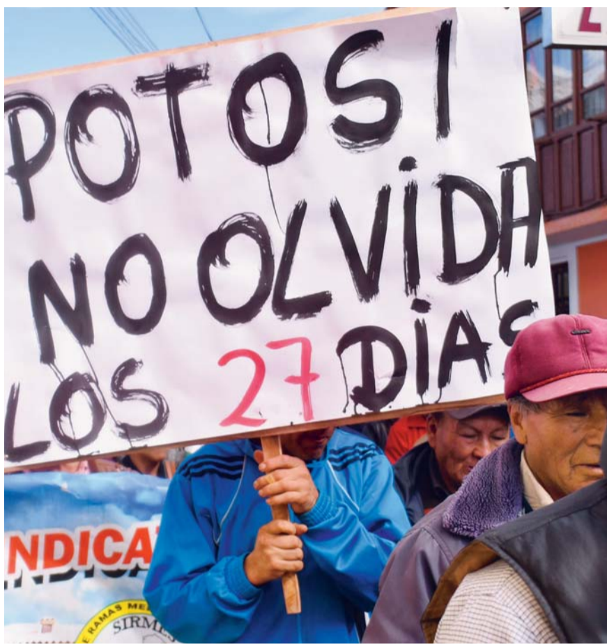
MANIFESTACIÓN DE COMCIPO RECORDÓ LOS DÍAS DE MOVILIZACIÓN POR DEMANDAS DE POTOSÍ, QUE NO TUVIERON ÉXITO.

• Mientras un sector del MAS insiste en que no se debieran mostrar carteles de “Bolivia dijo NO” en festejos patrios, otro pide que las expresiones sean pacíficas y respetuosas