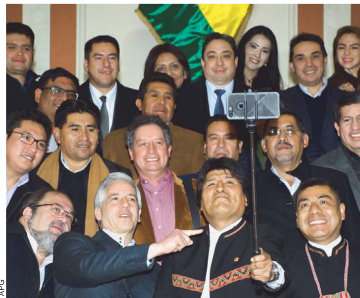
SELFIE DE EVO MORALES CON SU GABINETE. FUE AYER EN EL “PALACIO QUEMADO”.