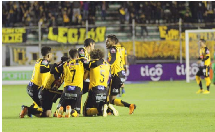
FESTEJO ATIGRADO POR LA VICTORIA QUE LO CONVIERTE EN LÍDER DEL CAMPEONATO.