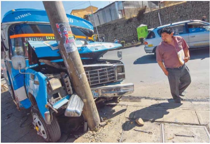
IMÁGENES DE DOS ACCIDENTES OCURRIDOS AYER. UNO EN COCHABAMBA Y OTRO EN LA PAZ.