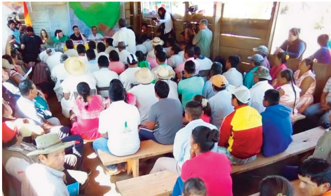
TRIBUNAL INTERNACIONAL POR LOS DERECHOS DE LA NATURALEZA EN AUDIENCIA CON LOS COMUNARIOS QUE ESTÁN EN CONTRA DE LA CONSTRUCCIÓN DE LA VÍA. FUE AYER EN TRINIDADCITO.

• Los representantes del organismo internacional concluyeron ayer la audiencia en Trinidadcito y anunciaron que entregarán un informe al Papa Francisco, acerca de las quejas recibidas