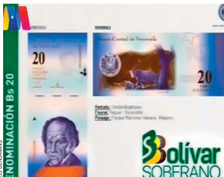
ASÍ LUCEN LOS NUEVOS BILLETES QUE CIRCULAN EN VENEZUELA.