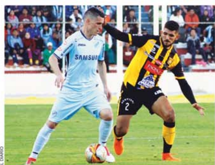
INCIDENCIAS DEL PARTIDO CLÁSICO DISPUTADO EN ABRIL PASADO.