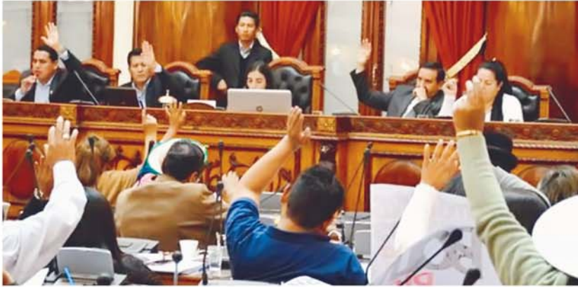
LA MAYORÍA OFICIALISTA EN LA CÁMARA DE DIPUTADOS, NUEVAMENTE VALIDÓ UN QUESTIONADO PROYECTO DE LEY.

UD solicita someter proyecto a control de constitucionalidad