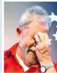
EXPRESIDENTE LULA DA SILVA.

Luiz Inácio Lula da Silva no podrá ser candidato a presidente por sexta vez por determinación de la Justicia Electoral de Brasil, tras haberse aferrado a la ley que impide a los condenados en segunda instancia aspirar a ese privilegio.