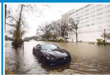
Un gran número de personas personas han quedado incomunicadas debido a las consecuencias de Florence.