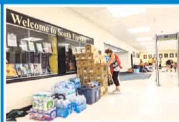
Florence, convertida ya en tormenta tropical, ha dejado sin abastecimiento a gran parte de la población.