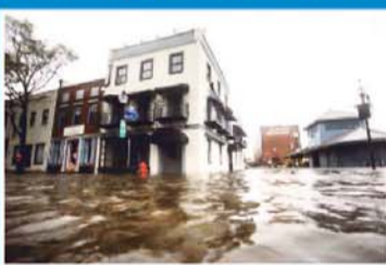
Las aguas inundan las calles a la llegada del huracán Florence a las calles de Carolina del Norte.