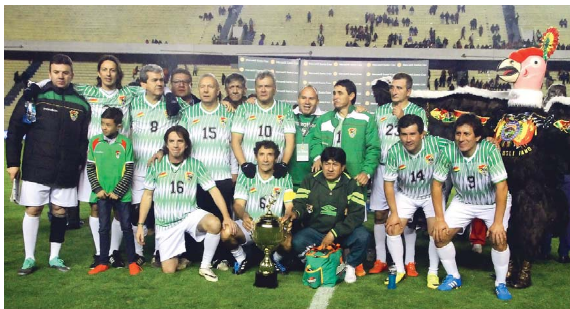
LA SELECCIÓN NACIONAL REVIVIÓ EN LA AFICIÓN BOLIVIANA EL HITO HISTÓRICO DE CLASIFICACIÓN AL MUNDIAL DE ESTADOS UNIDOS 1994.

'La casa con un reloj en sus paredes' es la nueva película de misterio, terror y ficción del director Eli Roth. Esta es la primera adaptación cinematográfica de la saga literaria infantil publicada en 1973, escrito por John Bellairs.