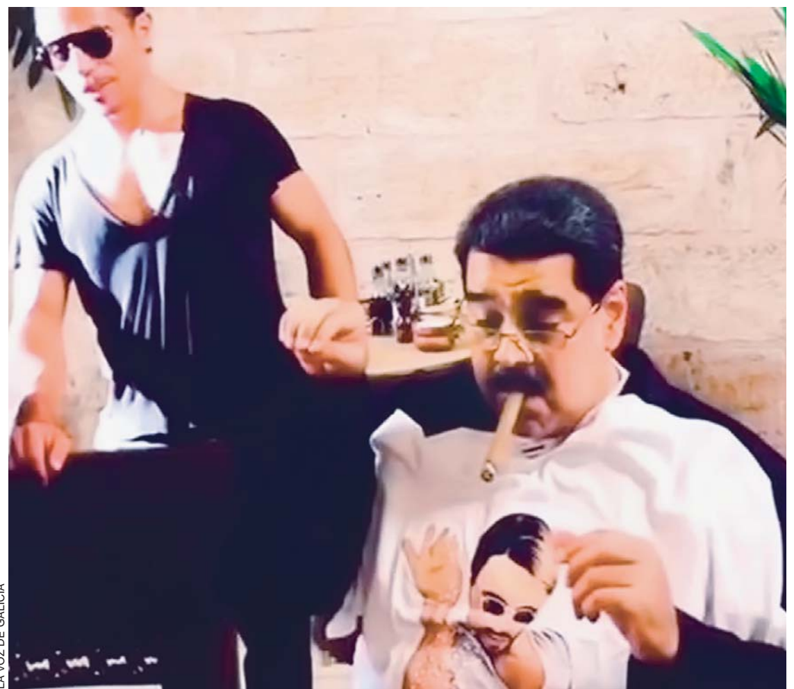
"ESTO ES UNA SOLA VEZ EN LA VIDA ¿VERDAD?", DICE MADURO EN UNO DE LOS VIDEOS JUNTO AL FAMOSO COCINERO NUSRET GÖKÇE.