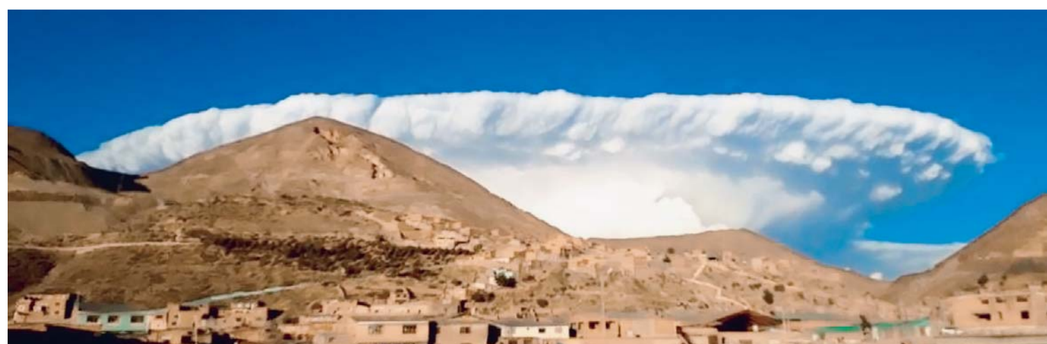
ESTA IMAGEN FUE PUBLICADA EN LA CUENTA DEL TWITTER DEL PRESENTADOR DE TELEVISIÓN JUAN CARLOS ARANA Y SE HICIERON VIRALES.

El jueves en las poblaciones de Huanuni y Llallagua en el cielo se vieron nubes con una curiosa forma semejante a un hongo producto de la explosión de una bomba atómica. Las imágenes llamaron la atención más porque en esta época del año la lluvia es escasa y se incrementa la temperatura en todo el occidente del país.