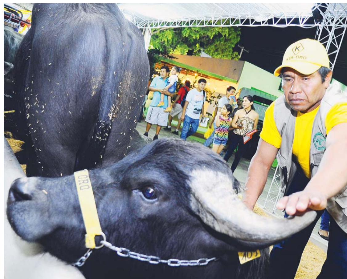
SE INAUGURÓ ANOCHE LA EXPOFERIA DE SANTA CRUZ DE LA SIERRA, CON GRANDES NOVEDADES Y CON EL MAYOR CENTRO DE NEGOCIOS DE LA GESTIÓN 2018.