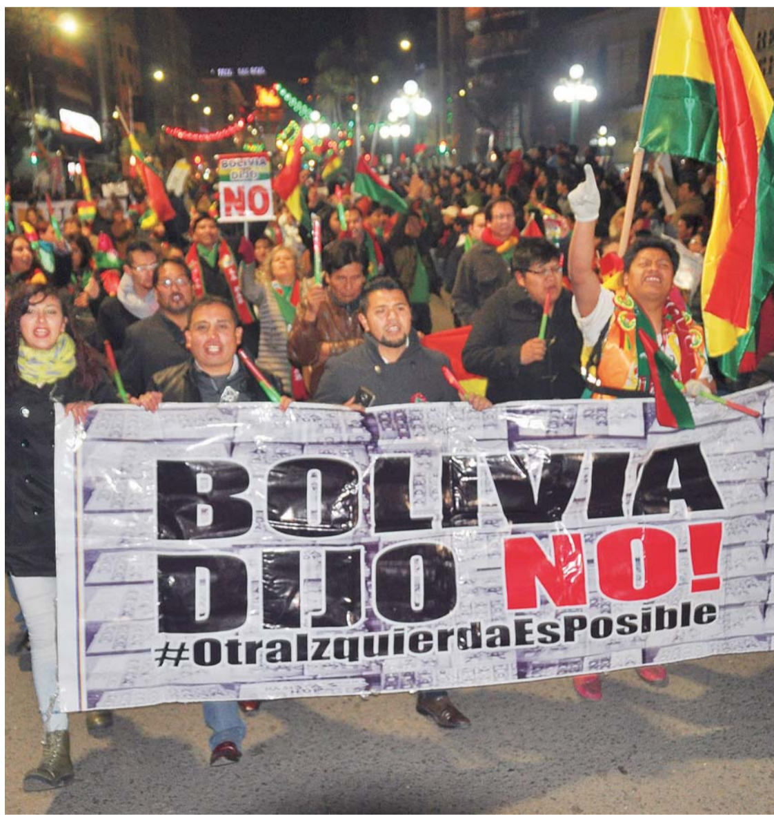
MOVILIZACIÓN DE PLATAFORMAS CIUDADANAS PIDEN RESPETO A SU VOTO.