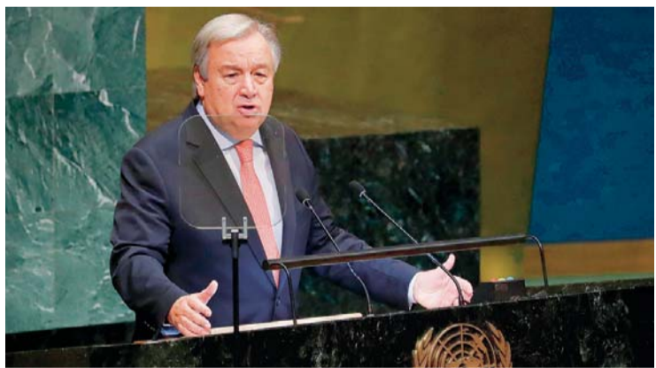
SECRETARIO GENERAL DE LA ORGANIZACIÓN DE NACIONES UNIDAS (ONU), ANTONIO GUTERRES.

El secretario general de la Organización de Naciones Unidas (ONU), António Guterres, advirtió ayer a los líderes mundiales sobre el auge de la división y del populismo en la apertura de los debates de la Asamblea General de Naciones Unidas.