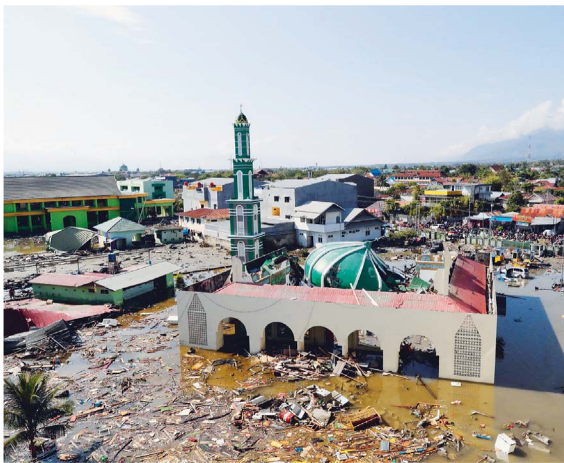
VISTA GENERAL DE UNA MEZQUITA DEVASTADA POR UN TSUNAMI EN LA PLAYA DE TALISE, PALU, SULAWESI CENTRAL, INDONESIA, 30 DE SEPTIEMBRE DE 2018.