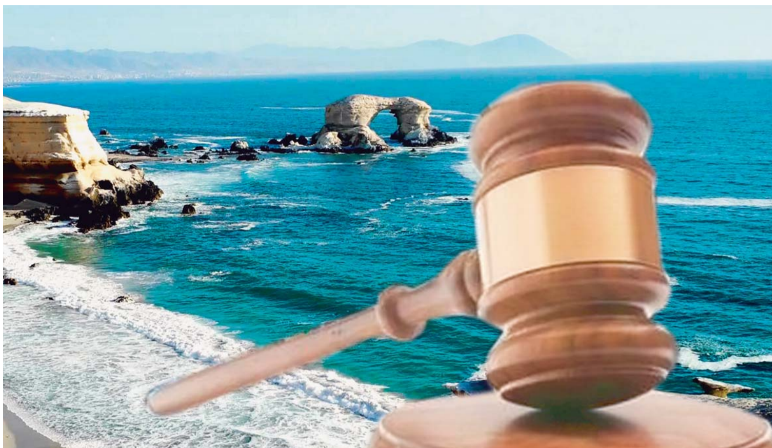
BOLIVIA AGUARDA EL FALLO DE LA CORTE INTERNACIONAL DE JUSTICIA DE LA HAYA A LA DEMANDA MARÍTIMA, DESPUÉS DE 139 AÑOS DE UN ENCLAUSTRAMIENTO FORZOSO POR LA INVASIÓN CHILENA.