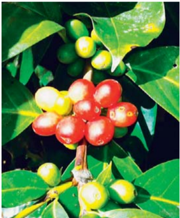
LA PLAGA ROYA QUE AFECTA AL CAFÉ PUEDE SER COMBATIDO POR UNA NUEVA SEMILLA.

Asimismo, manifestó que café es exportado a Estados Unidos y Europa, tomando en cuenta que la libra de café se cotiza en 98 dólares en el mercado internacional.