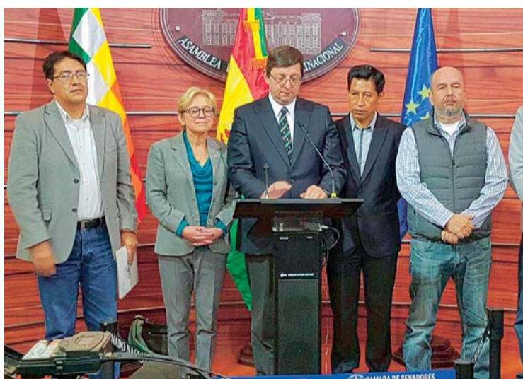
BANCADA DE UNIDAD DEMOCRATA.