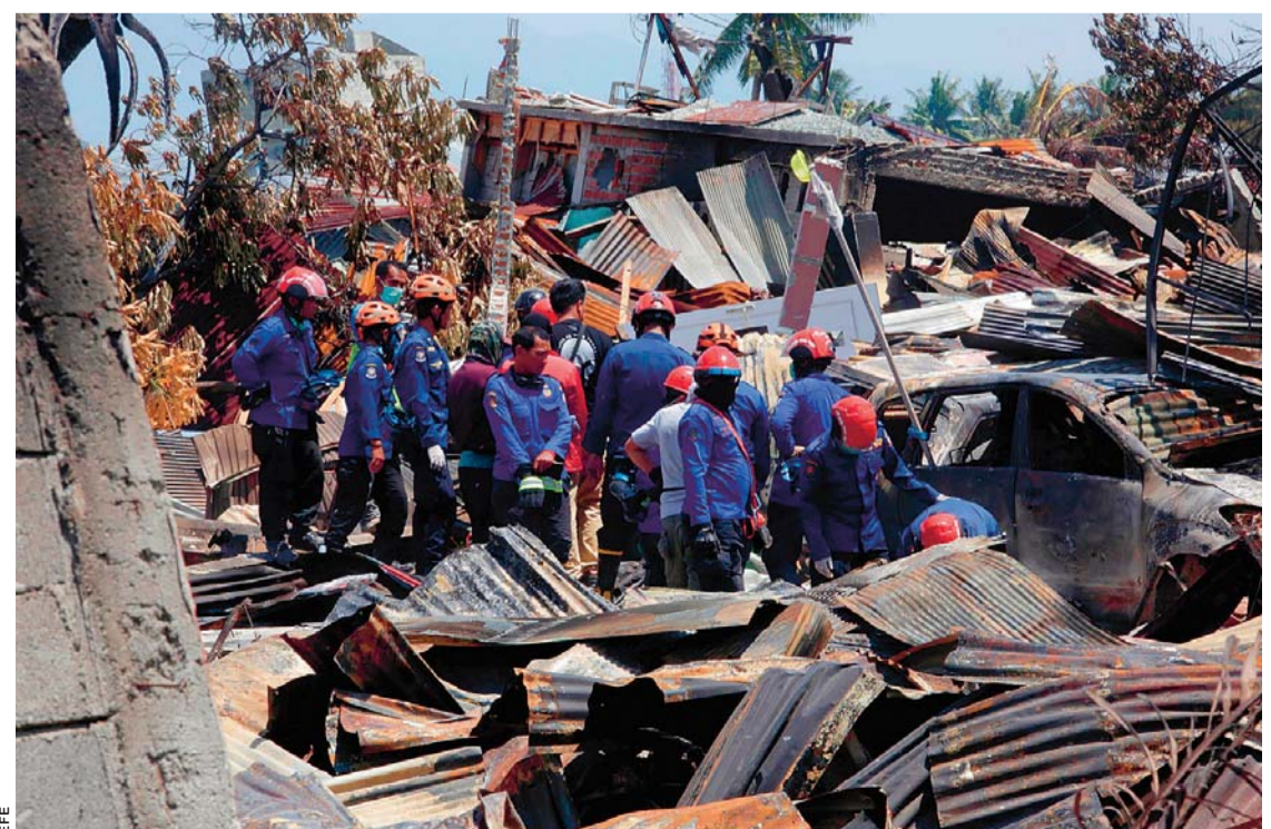
RESCATE DE VÍCTIMAS EN INDONESIA.

El número de heridos graves que se encuentran ingresados en distintos hospitales ha subido a 2.549 y el de desaparecidos, que la víspera no llegaba al centenar, ha pasado a 114.