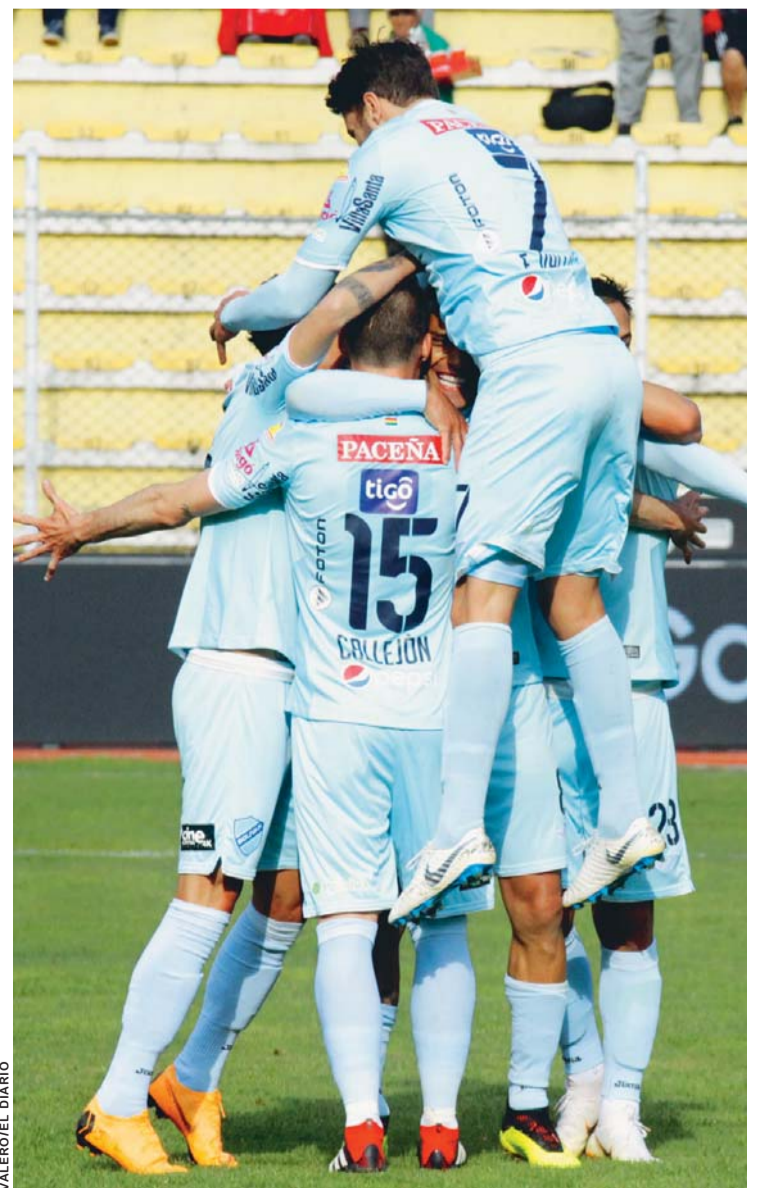
BOLÍVAR FESTEJÓ EL TRIUNFO EN UN LUCHADO PARTIDO QUE TUVO GOLES PARA TODOS LOS GUSTOS.

En cambio, Royal Pari, en ningún instante bajó la guardia y en varias oportunidades estuvo a punto de remontar el marcador, pese a que pesó en su contra el hecho de ser visitante.