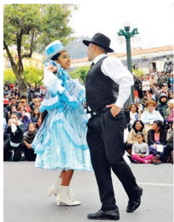
LA CUECA BOLIVIANA.

disputado con mucho ímpetu y malas defensas.