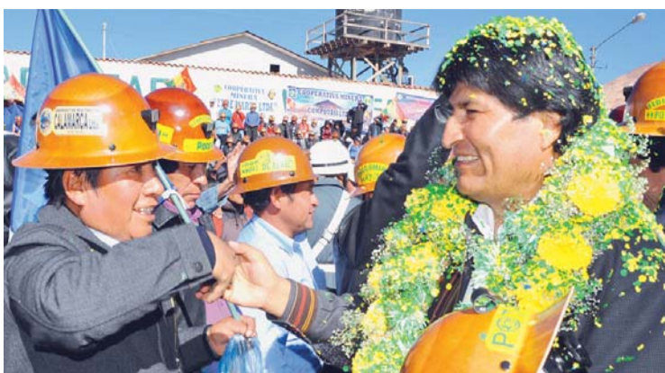
IMAGEN DE ARCHIVO MUESTRA EL ACERCAMIENTO DE ESTE SECTOR AL PRESIDENTE EVO MORALES EN GESTIONES PASADAS.