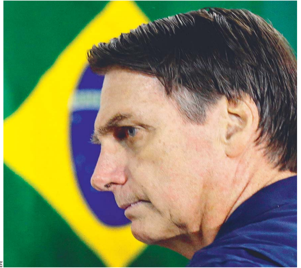
JAIR BOLSONARO DEBE ESPERAR LA REALIZACIÓN DE UNA SEGUNDA VUELTA DE VOTACIÓN EN BRASIL.

Pidió a sus seguidores que “continúen movilizados”, pues la “victoria final” será el próximo 28 de octubre. “No deja de ser una gran victoria”, dijo en una transmisión en directo desde su domicilio, donde se recupera de las heridas que sufrió el pasado 6 de septiembre, cuando fue acuchillado durante un mitin. “No teníamos una gran estructura, somos un partido muy pequeño y estuve hospitalizado unos 30 días”, por lo que “es un gran triunfo”, agregó el candidato en alusión a los casi