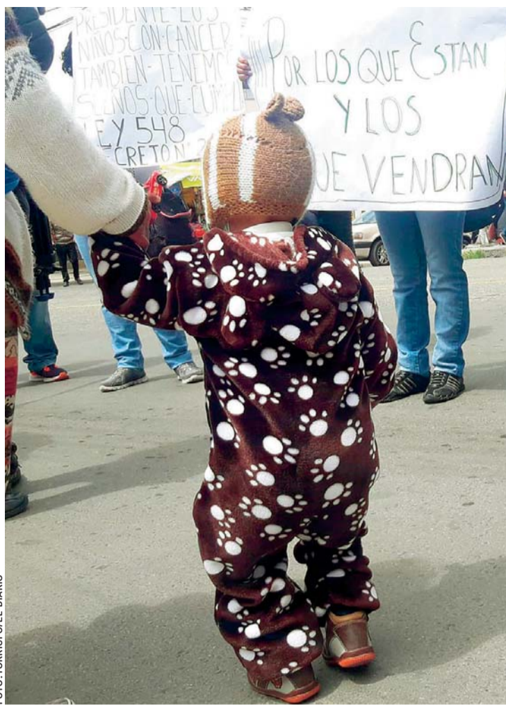
MARCHA DE NIÑOS CON CÁNCER EN LA SEDE DE GOBIERNO.

“Seis individuos ingresaron a la galería comercial Shopping Center Graneros, maniatando a la hija del propietario y al portero de 61 años. Los delincuentes buscaban en el edificio, de siete pisos, el departamento o ambiente donde se tiene guardado oro, pero la llegada de nuestro personal al parecer frustró el robo”, declaró.