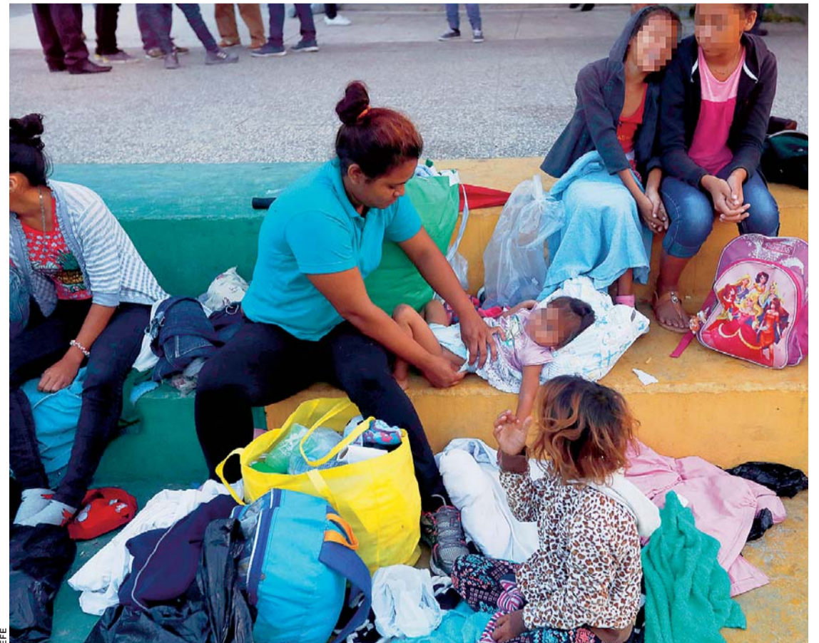
CIENTOS DE MIGRANTES HONDUREÑOS AMANECIERON AYER, VIERNES 26 DE OCTUBRE, EN EL PARQUE DE AYUTLA EN TECÚN UMÁN (GUATEMALA).

La portavoz especificó que muchos de los niños y sus familias están huyendo de la violencia de las pandillas, especialmente de género, extorsión, pobreza y acceso limitado a educación de calidad y servicios sociales en sus países de origen.