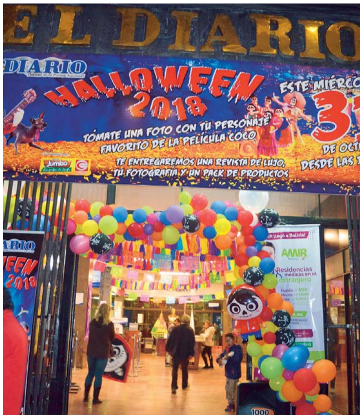
NUESTRA CASA ESTÁ LISTA PARA RECIBIR UN AÑO MÁS A CIEN- TOS DE NIÑOS Y JÓVENES CON LOS DISFRACES MÁS DIVERTI- DOS DE HALLOWEEN.

chicos se plasmará en el mejor disfraz que puedan crear y con la caracterización más ingeniosa podrán posar frente a las cámaras de EL DIARIO, además de pasar una jornada "de película". ¡Habrán premios y grandes sorpresas! Te esperamos a partir de horas 15.00.