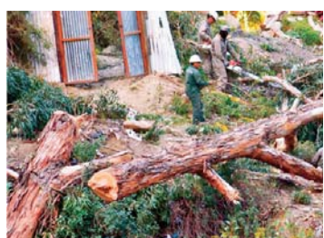
TALA DE ÁRBOLES EN LA PAZ.

La Secretaría Municipal de Gestión Ambiental envió una