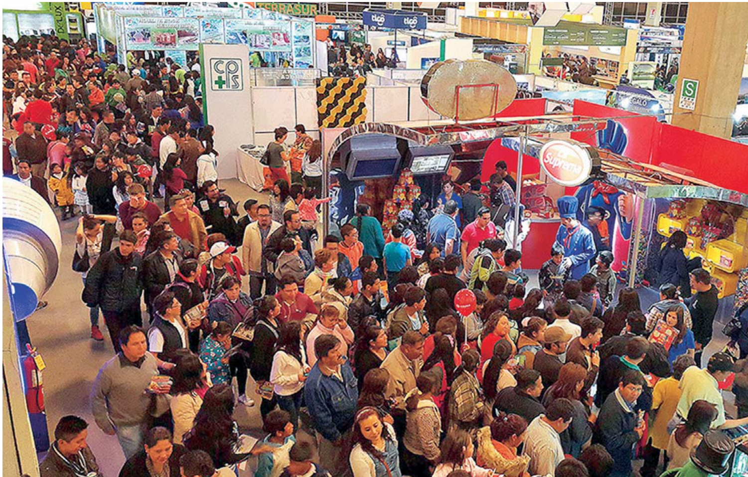
FIPAZ 2018 AYER CERRÓ SUS PUERTAS CON UNA MASIVA ASISTENCIA DEL PÚBLICO QUE CALIFICÓ EL EVENTO EMPRESARIAL DE “ALTAMENTE EXITOSO”.