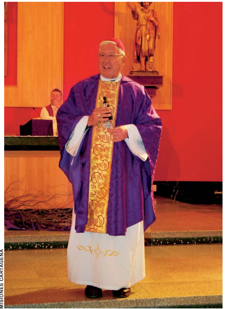
MONSEÑOR JESÚS JUÁREZ, ARZOBISPO DE SUCRE.

El Comité pro Santa Cruz encabezó el anuncio de un paro cívico nacional con efecto en ocho regiones; este será movi-