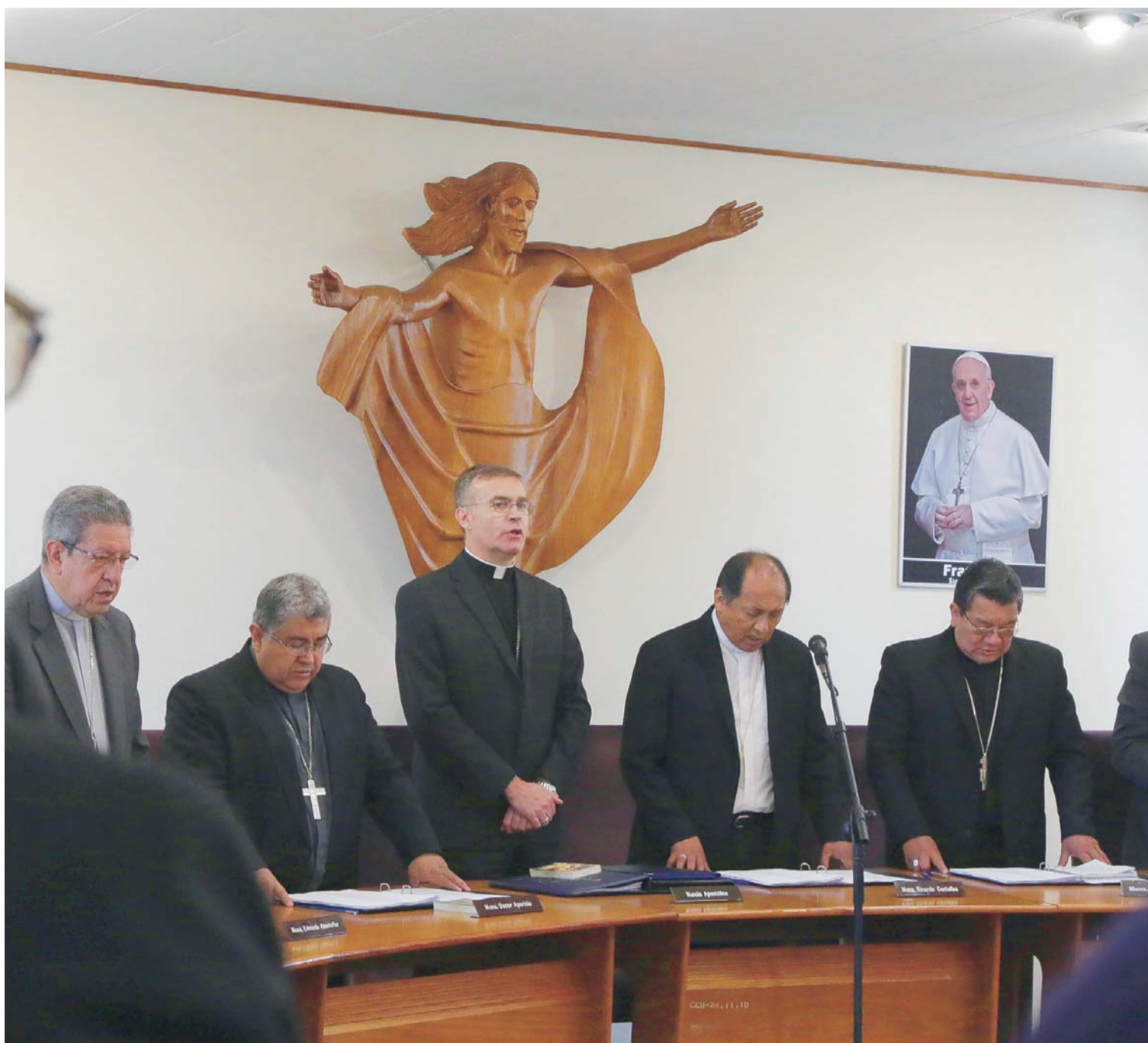
INAUGURACIÓN DE LA CV ASAMBLEA PLENARIA DE LOS OBISPOS DE BOLIVIA.

A menos de una semana que se hiciera pública la resolución del Banco Central de Bolivia (BCB), de suspender la venta de dólares en sus ventanillas en la sede de Gobierno, algunas casas de cambio retiraron de su oferta los billetes de la moneda estadounidense, mientras que las entidades del sistema financiero privado mantienen la compra y venta del dólar, pero con más de diez puntos de diferencia en el tipo de cambio respecto de su valor oficial.