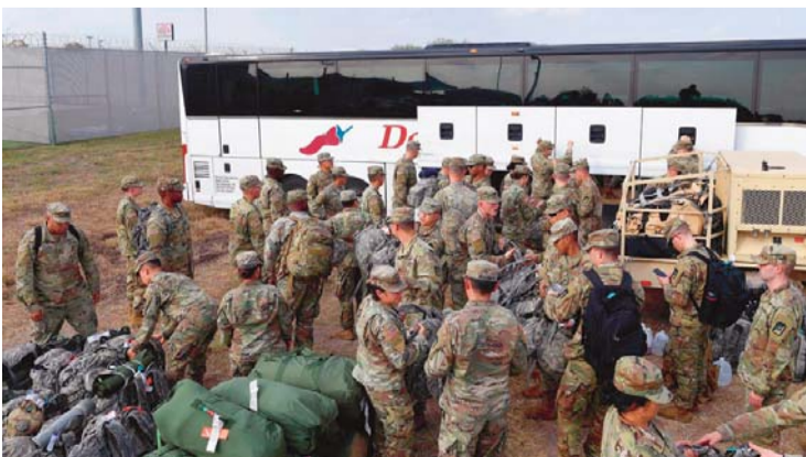
GRUPO DE SOLDADOS ESTADOUNIDENSES QUE LLEGÓ AYER A LA FRONTERA, ENTRE SAN DIEGO (CALIFORNIA) Y TIJUANA (MÉXICO).

San Diego (EEUU).- Un grupo de soldados llegó ayer a la frontera estadounidense entre San Diego (California) y Tijuana (México), para reforzar la seguridad ante el posible arribo de la caravana de migrantes que partió hace casi un mes de Honduras