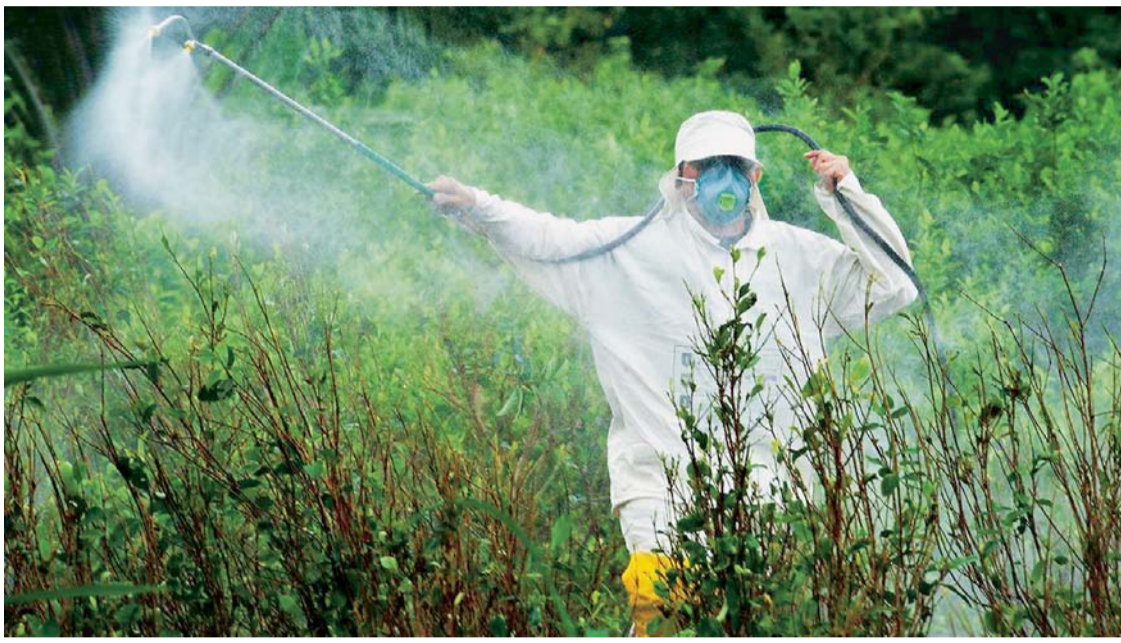
EL GIGANTE AGROINDUSTRIAL MONSANTO FUE PENADO A PAGAR UNA MILLONARIA COMPENSACIÓN A UN JARDINERO QUE CONTRAJÓ CÁNCER TERMINAL POR USAR ESTE QUÍMICO.