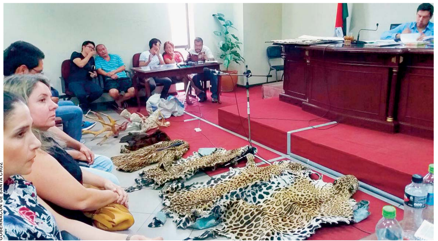
CIUDADANOS CHINOS QUE COMERCIALIZARON PIELES Y COLMILLOS DE JAGUARES DE BOLIVIA FUERON SENTENCIADOS CON CUATRO Y TRES AÑOS DE PRISIÓN.

Ortega ha rechazado todas las acusaciones y se ha proclamado vencedor de un intento de "golpe de Estado".