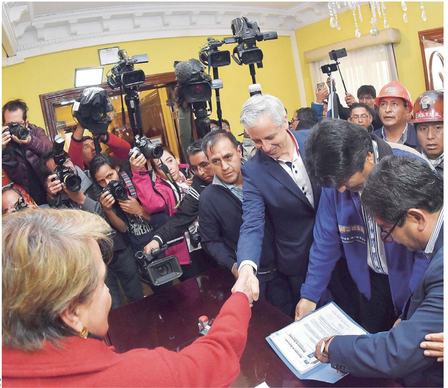
BINOMIO DEL MOVIMIENTO AL SOCIALISMO EN EL TRIBUNAL SUPREMO ELECTORAL.

> Registro de binomios refleja que la realización de las elecciones primarias no tendría sentido, sin embargo, la Ley de Organizaciones Políticas obliga a que se realice este evento que costará casi Bs 27 millones