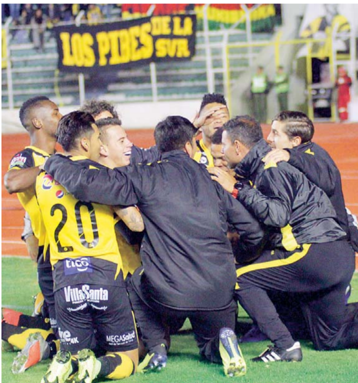
FESTEJO "ATIGRADO" QUE ALCANZÓ EL SEGUNDO LUGAR EN EL TORNEO CLAUSURA.