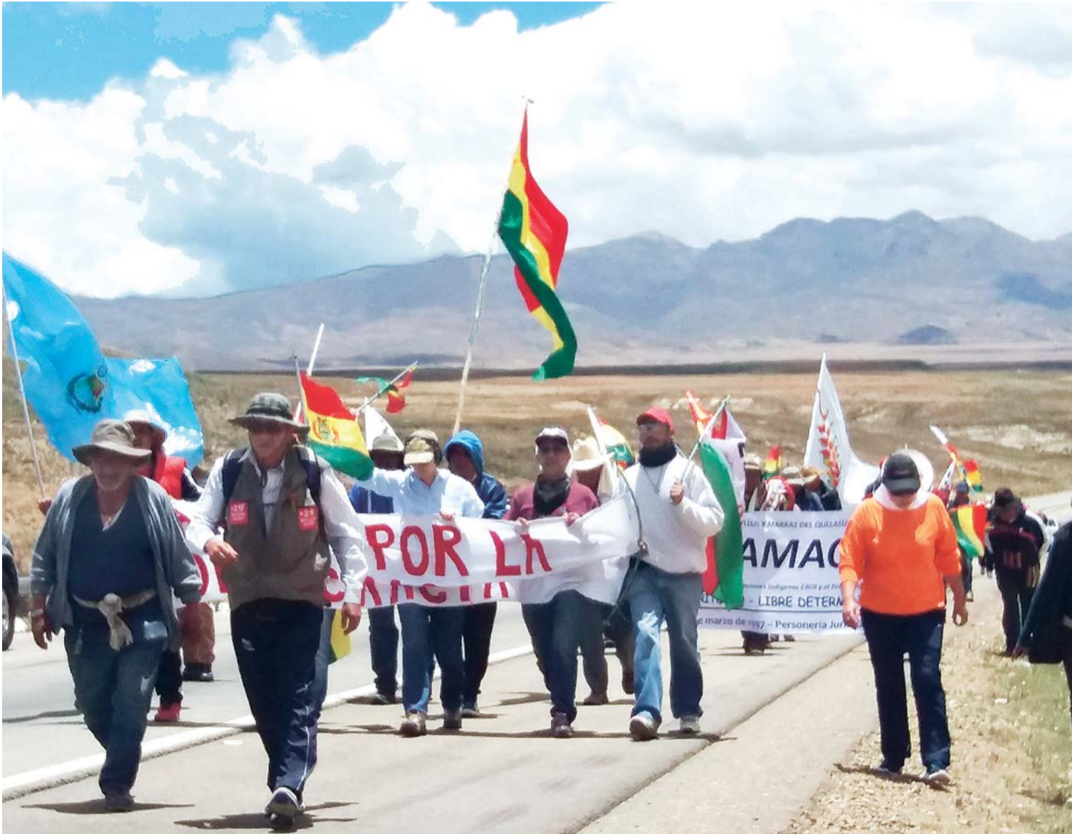
CAMINATA DE ACTIVISTAS EN DEFENSA DE LOS RESULTADOS DEL REFERÉNDUM VINCULANTE DEL 21 DE FEBRERO DE 2016.

> EL DIARIO pudo comprobar que varias decenas de marchistas avanzan a pesar de los efectos climáticos, el cansancio y las ampollas en los pies para pedir la inhabilitación del binomio Morales-García > Cívicos de ocho departamentos confirmaron paro con movilizaciones para el jueves 6