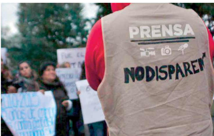
INSEGURIDAD EN LA LABOR DE LA PRENSA EN MÉXICO.

tención domiciliaria y pese a que intentó reasumir funciones no fue autorizado por el Consejo Municipal.