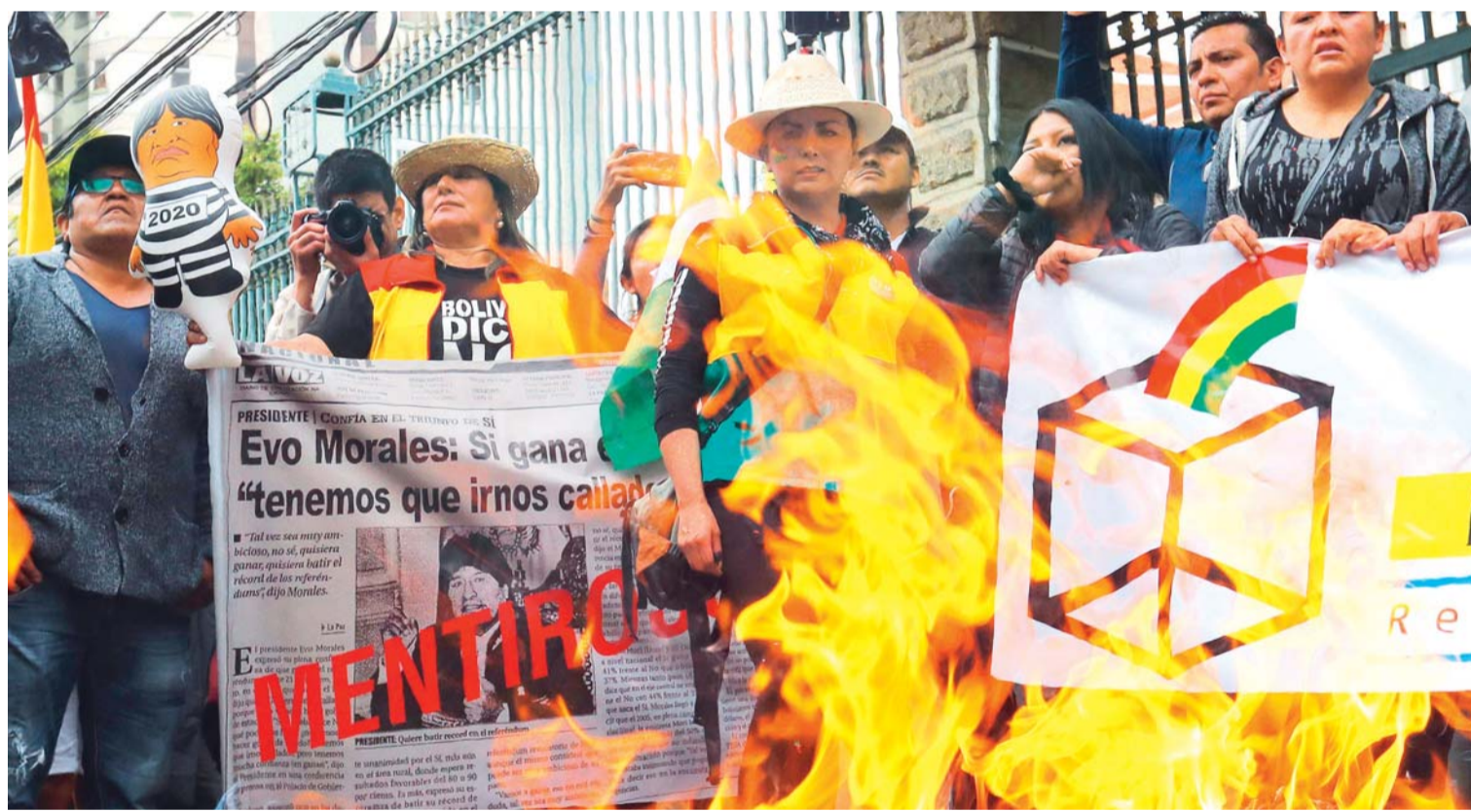
PROTESTA DE PLATAFORMAS CIUDADANAS EN CONTRA DE HABILITACIÓN DEL BINOMIO MASISTA. FUE LA ANTERIOR SEMANA.

> El presidente Evo Morales afirmó que "expresidentes de España y América Latina, que rechazan su repostulación, defienden al imperio y al capitalismo"