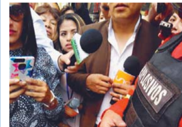
OBJETO QUE INQUIETÓ A TRANSEÚNTES Y BOMBEROS, RESULTÓ SER FALSA ALARMA DE BOMBA.

Ramírez explicó que por las características del objeto se llamó a la Brigada Especial Contra Explosivos de Bomberos, para descartar la presencia de un artefacto explosivo. (Radio Fides)