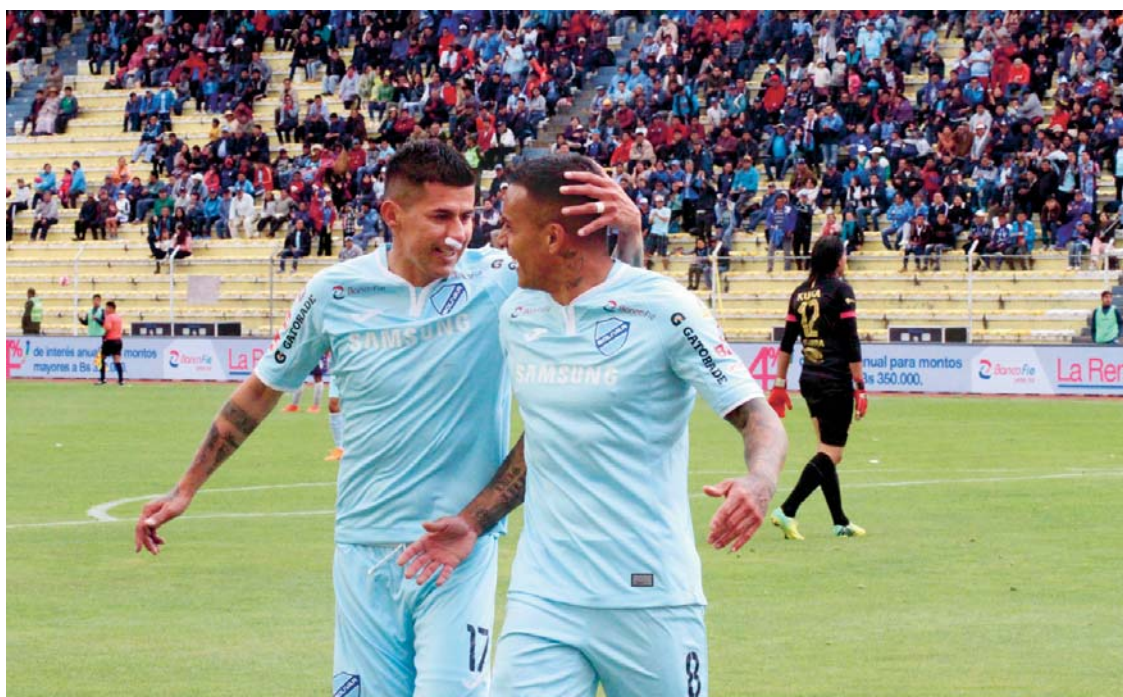
FESTEJO BOLIVARISTA POR EL CONTUNDENTE RESULTADO.