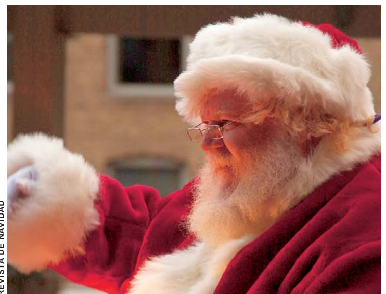
MENSAJES DE PAZ Y AMOR PARA TUS SERES QUERIDOS, JUNTO A PAPANOEEL, EN EL DIARIO.

EL DIARIO, sigue premiando la fidelidad de nuestros lectores con esmerados productos especiales.