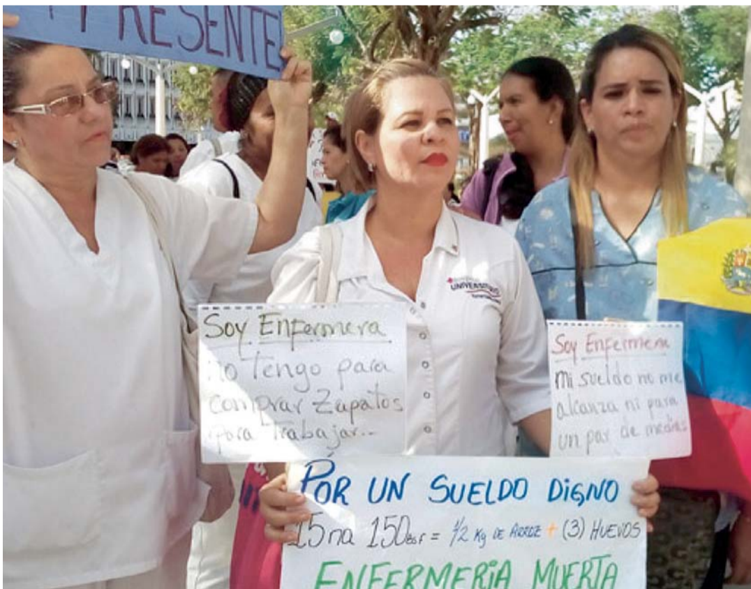
HUELGA DEL COLEGIO DE ENFERMEROS DE CARACAS.