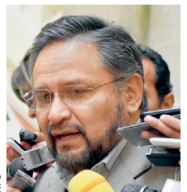
ALFREDO RADA, MINISTRO DE LA PRESIDENCIA.

> El reglamento del pago del segundo aguinaldo establece un tope salarial de Bs 15.000, además determina que el 15% sea para comprar productos nacionales