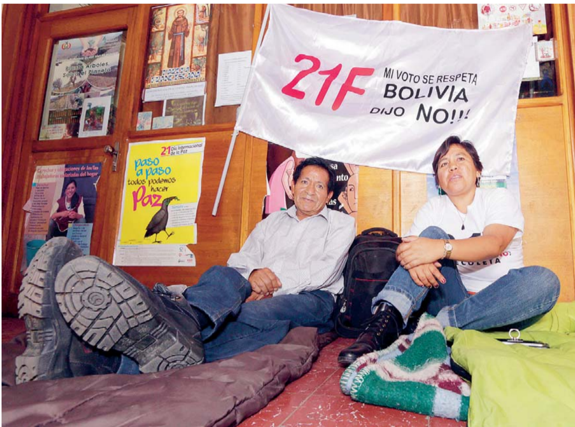
AYUNO VOLUNTARIO DE CÍVICOS COCHABAMBINOS.