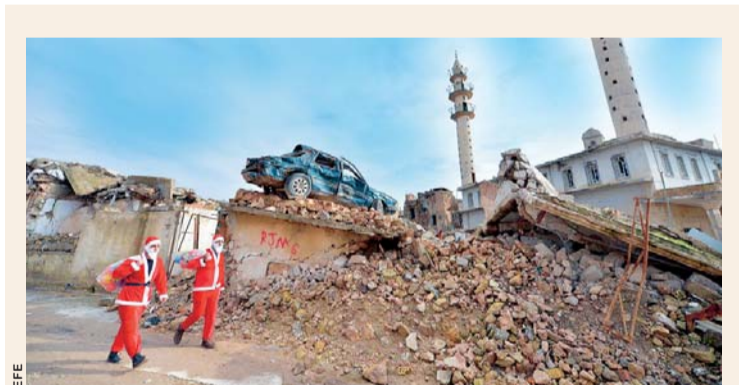
MOJUL (IRAQ).- DOS HOMBRES IRAQUÍES VESTIDOS COMO PAPA NOEL CAMINAN EN MEDIO DE EDIFICIOS EN RUINAS PARA DISTRIBUIR REGALOS A LOS NIÑOS DURANTE LAS CELEBRACIONES NAVIDEÑAS, EN EL ÁREA DE LA CIUDAD VIEJA EN EL OESTE DE MOSUL, EN EL NORTE DE IRAK. APROXIMADAMENTE EL CINCO POR CIENTO DE LOS IRAQUÍES SON CRISTIANOS.

Contreras indicó que al menos 6.000 enfermeras se han ido del país debido a la crisis económica que se traduce en hiperinflación, escasez generalizada, devaluación de la moneda y fallas en todos los servicios públicos.