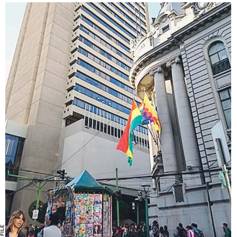
BANCO CENTRAL DE BOLIVIA- LA PAZ

El ente emisor informó precisó que las Reservas Internacionales Netas (RIN) alcanzaron al 21 de diciembre 8.608 millones de dólares. El 2014 logró un máximo de 15.123 millones, y durante los últimos cuatro años la pérdida acumulada ascendió a alrededor de 6.515 millones.