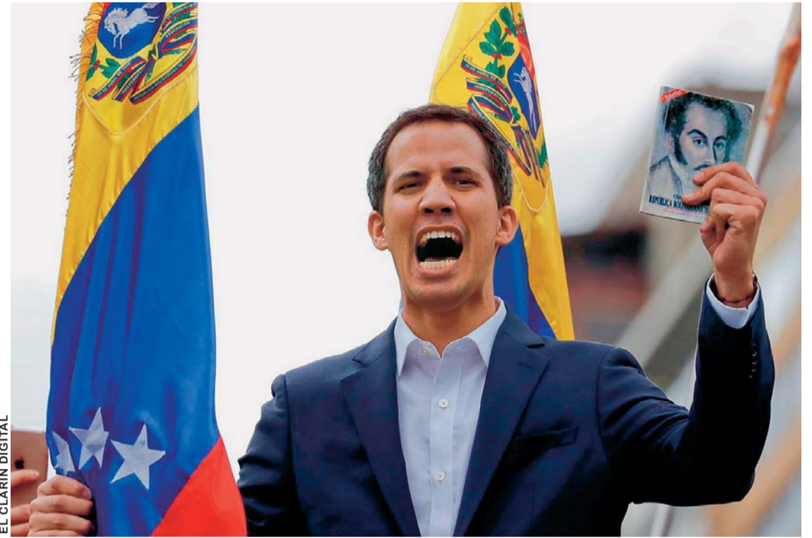
EL CLARIN DIGITAL

LA HISTORIA DE VENEZUELA DA UN GIRO IMPORTANTE DESDE AYER CON EL APOYO INTERNACIONAL QUE RECIBE JUAN GUIDÓ.