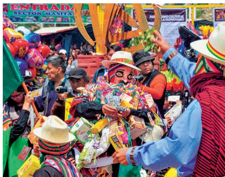
EL EKEKO SERÁ EL PERSONAJE CENTRAL EN LA INAUGURACIÓN DE LA ALASITA 2019.

La mayoría de las personas ha conocido a su pareja en la edad adulta, hay algunas excepciones, por ejemplo, las personas que son del mismo barrio o escuela y se conocen desde la infancia, pero como dijimos son excepciones, por eso, debemos entender que nuestra pareja hubiera tenido una o varias relaciones antes que la actual, esto, a muchas personas les causa conflicto.