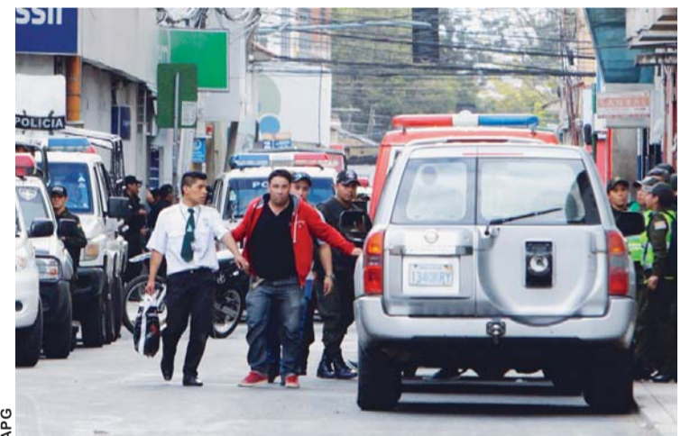
OPERATIVO POLICIAL EN EL LUGAR DEL ATRACO FRUSTRADO.