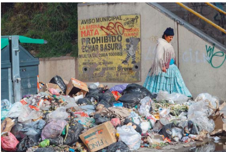
BASURA EN LA PAZ SE HA CONVERTIDO EN EL PROBLEMA URBANO MÁS GRANDE Y PELIGROSO PARA LA POBLACIÓN.

La Alcaldía pide no sacar la basura de las casas, pero los vecinos no pueden convivir con contaminantes. Las enfermedades comienzan a brotar.