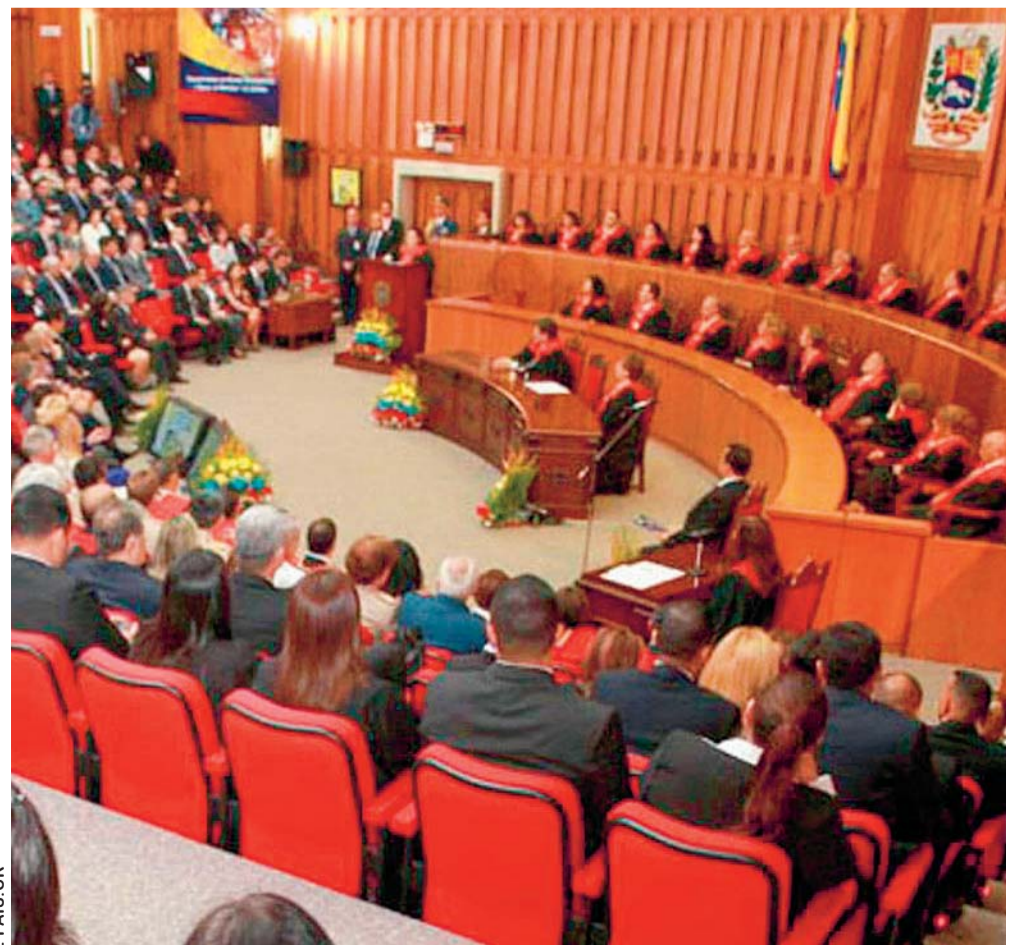
TRIBUNAL SUPREMO DE JUSTICIA (TSJ) DE VENEZUELA.

Horas antes, el fiscal general de Venezuela, Tareck William Saab, había anunciado la apertura de una investigación preliminar contra Guaidó, reportó la agencia Europa Press.