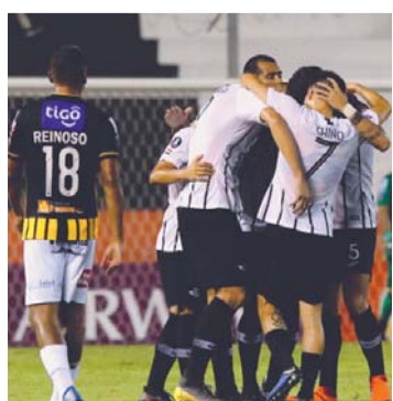
LIBERTAD APABULLÓ A THE STRONGEST.

The Strongest cayó goleado 5 a 1 anoche en el estadio "Nicolás Leoz" de Asunción del Paraguay, frente al anfitrión Libertad, por la Copa Libertadores de América.