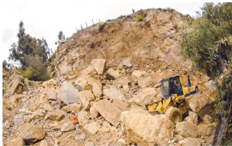
TAREAS DE EMERGENCIA EN LA VÍA QUE CONDUCE A MALLASA.