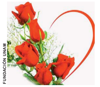
EL AMOR SE RESUME EN LA BELLEZA DE UNA FLOR.

Ven al Decano de la Prensa Nacional y perpetúa el día de San Valentín, junto a tu pareja.