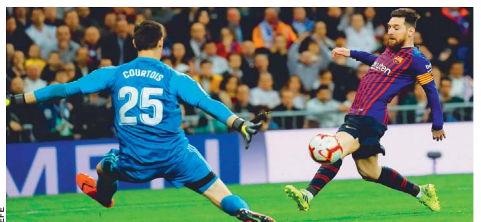
LEO MESSI FRENTE AL GUARDAMETA DEL REAL MADRID.

Así, el Barcelona infligió una segunda derrota en cuatro días a su clásico rival, el Real Madrid.