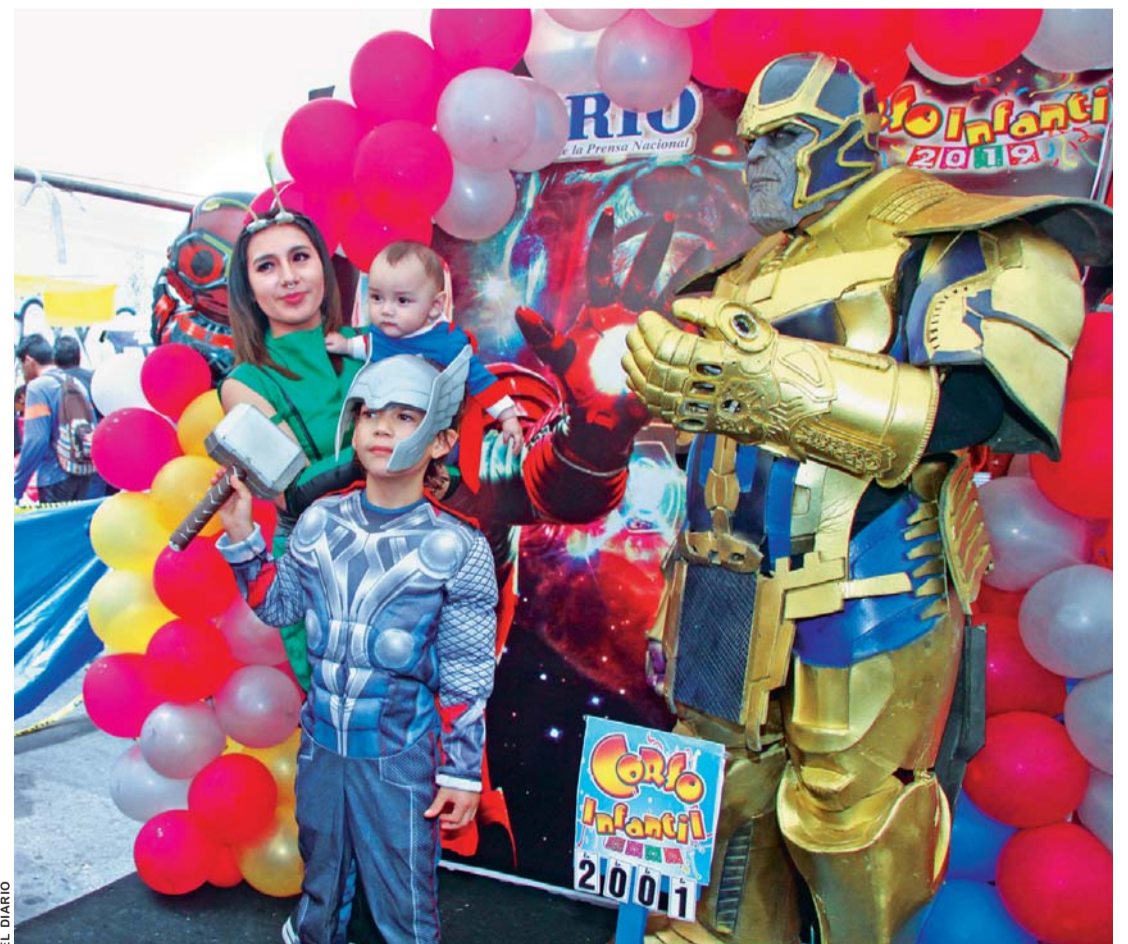
PADRES E HIJOS ASISTIERON MASIVAMENTE A LA CONVOCATORIA DE EL DIARIO. LOS MÁS PEQUEÑOS DE LA FAMILIA SE TOMARON FOTOGRAFÍAS CON SUS PERSONAJES FAVORITOS.

En la toma de fotos, con los lentes de EL DIARIO, se registró un instante de sus vidas que serán plasmados en fotografías y una revista de lujo. Nuestros visitantes, al margen al margen de divertirse, convivieron en una jornada interesante en el inicio de las fiestas carnavales. Al final, expresaron su satisfacción por esta actividad que se realiza cada año.