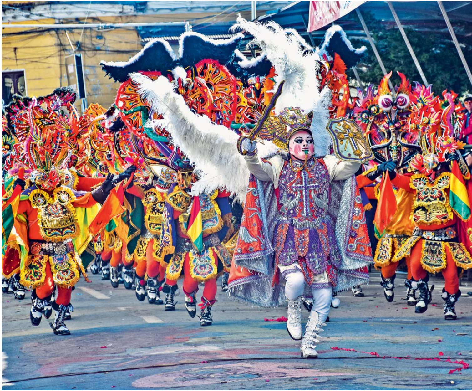
EL CARNAVAL DE ORURO FUE CALIFICADO POR EL PRESIDENTE DEL PARAGUAY, MARIO ABDO BENÍTEZ, COMO "MARAVILLOSA FESTIVIDAD TRADICIONAL Y POPULAR". ORURO MOSTRÓ, UNA VEZ MÁS, LA RIQUEZA FOLKLÓRICA DE BOLIVIA AL MUNDO.