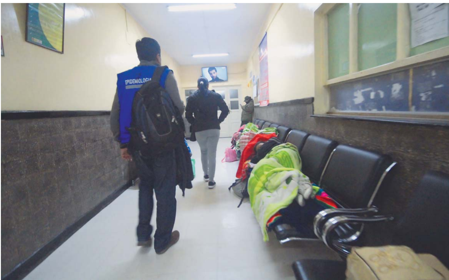
SALA DE ESPERA DE UN HOSPITAL DE TERCER NIVEL EN LA PAZ.