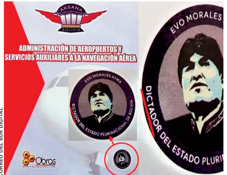
CARPETAS “ERRADAS” QUE FUERON DISTRIBUIDAS POR AASANA.