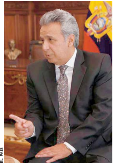
PRESIDENTE DE ECUADOR, LENÍN MORENO.

> El presidente interino de Venezuela, Juan Guaidó, dijo que Lenin Moreno acabó con el encubrimiento dictatorial del bloque regional