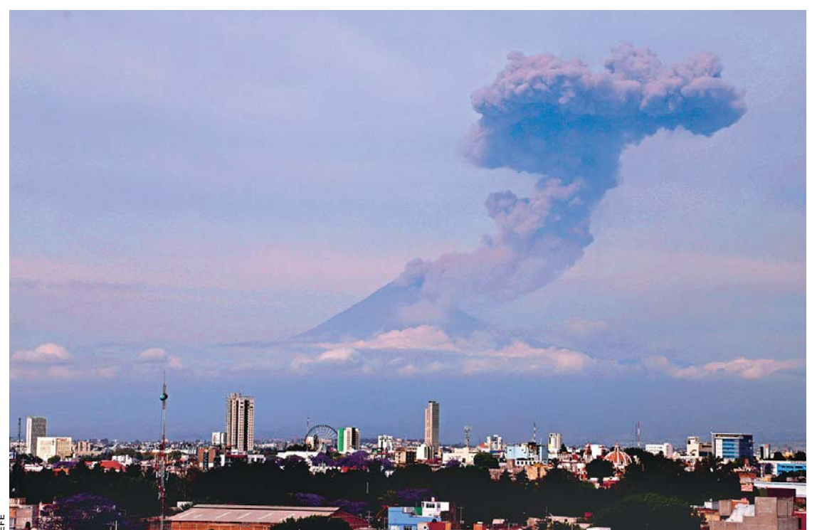
ACTIVIDAD VOLCÁNICA EN POPOCATÉPETL DE MÉXICO.

México.- El volcán Popocatepetl, cercano a Ciudad de México, registró una fuerte explosión con emisión de ceniza que alcanzó una altura de 1,2 kilómetros y material incandescente, informó ayer el Centro Nacional de Prevención de Desastres (Cenapred) de México.