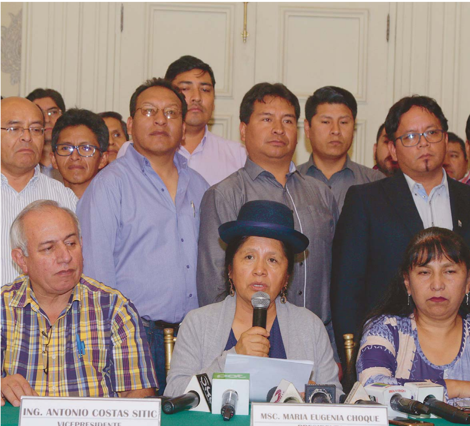
VOCALES DEL TRIBUNAL SUPREMO ELECTORAL EN EL MOMENTO QUE COMUNICABAN SU DETERMINACIÓN DE ADELANTAR LAS ELECCIONES. FUE AYER EN COCHABAMBA.